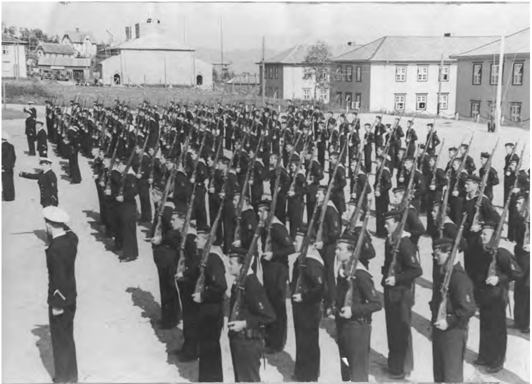
Når ubåtene lå i Nyhavna, var besetningen forlagt i Persaunet leir. Der var det rutinemessig oppstilling og inspeksjon på paradeplassen.

Den 15. mai 1954 ble flagget halt for siste gang på ubåtstasjonen på Persaunet. Det hadde vært et godt sted å være i over 8 år, og det var med vemod at ubåtpersonellet sa farvel til Persaunet og Trondheim by.