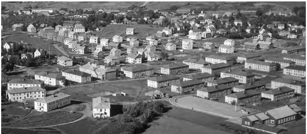
Del av Persaunet leir i 1952. Nederst til høyre på bildet ligger offisersmessa med inngang fra paradeplassen. De seks kasernene nærmest paradeplassen tilhørte UVB-våpenet. Utsnitt av flyfoto.