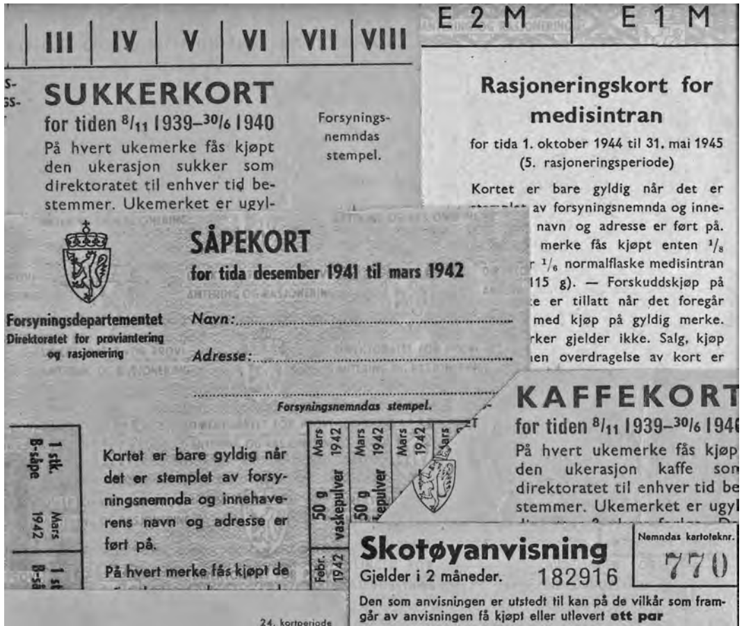
Et utvalg rasjoneringskort fra krigens tid utlånt av Berit Eggen.

bygningene var for solide, og DORA står der ennå. Lyden av ubåtene var også en ekkel lyd, kan jeg huske.