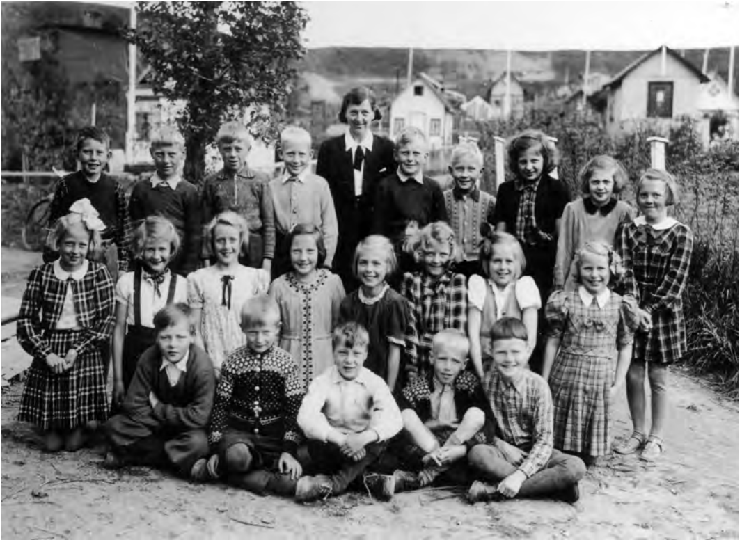
Klasse 3b, Berg skole, juni 1942 utenfor forsamlingshuset i Lerkendal hagekoloni.