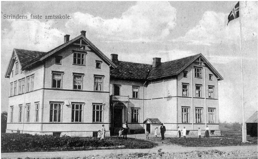
"Strindens faste amtsskole". Postkort sendt i 1914. Elevane sendte postkort med bilde av skulen.

vækker adskillig Misnøie, at der ikke skal gives Undervisning i Gymnastik, al den Stund Planen siger, at der skal være Gymnastik i 3 Timer for Ugen. Derfor slog Gutterne sig i sammen og leiede Lokalet, hvor der findes endel Gymnastikapparater, og anmodet Bestyreren om, at overtage Undervisningen, hvad jeg jo ikke kunde sige nei til, skjønt jeg fandt det litt leit, at Elev-erne selv til de andre Udgifter ogaaa skulde være nødt til at bekoste Gymnastiklokale. Jeg har henvendt mig til Amtsskolestyret om at bevirke, at Skolen leier Lokalet i Veiskillet - foreløbig til 1 Times Gymnastik for Ugen a Kr. 2.00 pr. Time med Lys og varme, og jeg haaber, vi til vinteren vil kunne have lidt Gymnastik ind paa Timeplanen, saa