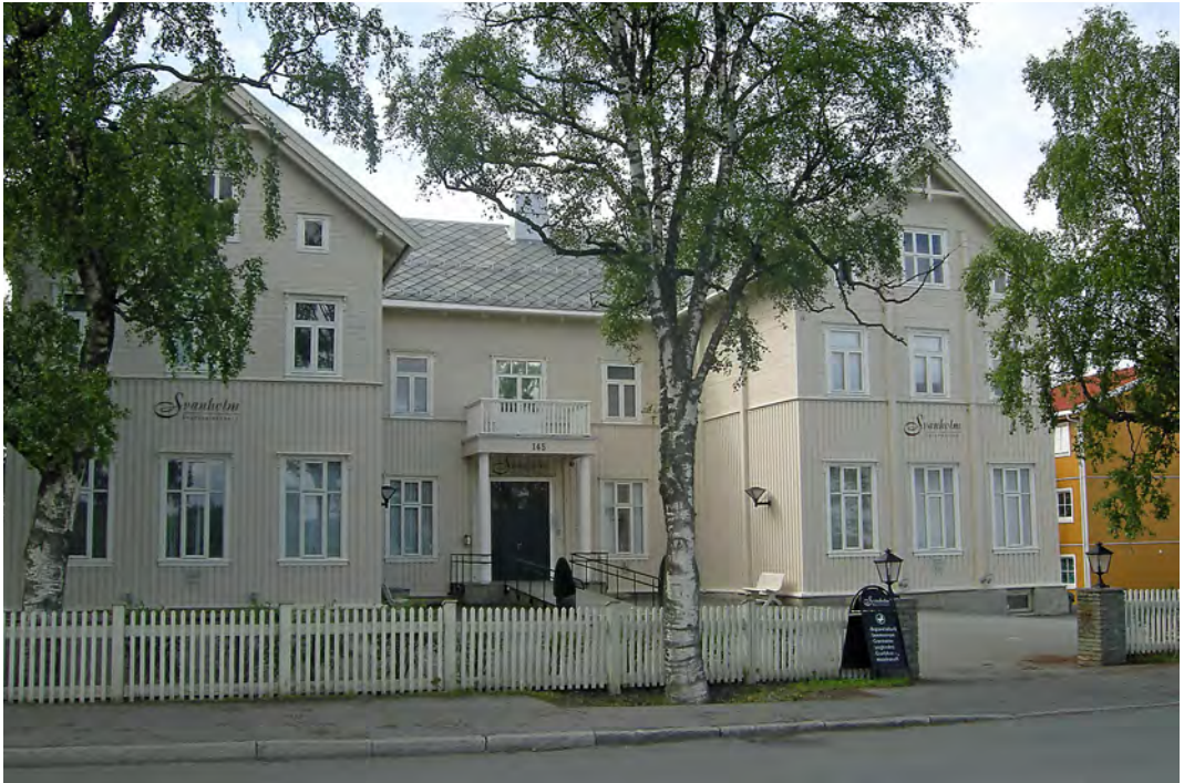
Skolebygningen i 2010. Eier er nå Svanholm begravelsesbyrå.