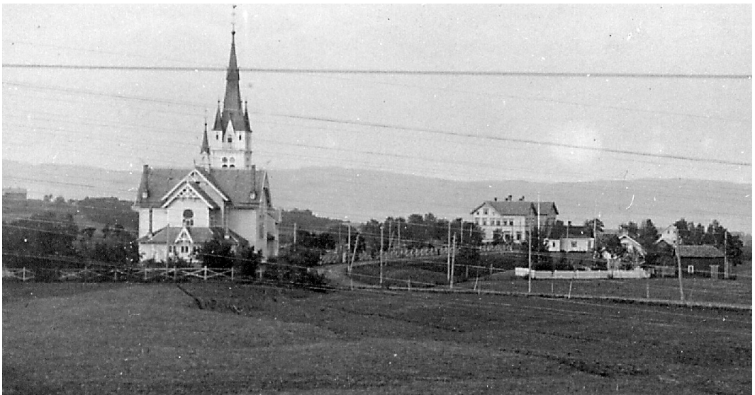
Strinda hovedkirke i forgrunnen. Amtsskulen på Moholt i bakgrunnen. Kirka vart innvigd i 1900.

I august 1902 vart flytting av skulen frå Meldal gjennomført, dessverre i ausande regnver. Bygningen var enno ikkje