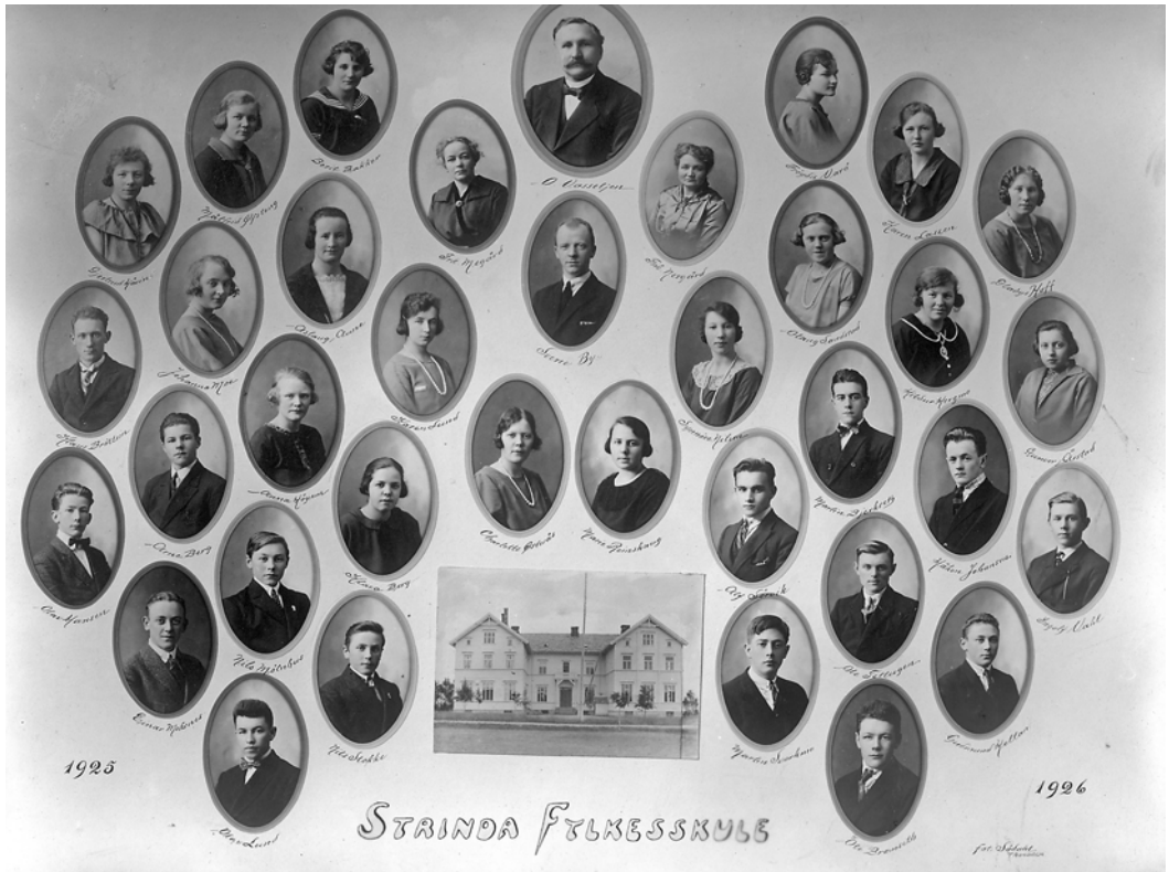
Elevbilde 1925 - 1926.

erindringer blev skolens bygninger sommeren 1925 benyttet som sykehus under tyfuspedemien, og da man mente at dette i høi grad vilde innvirke på søkningen til skolen i 1925-26, blev der fra fylkesskolestyret foretatt det nødvendige for å anbringe skolen på et annet sted i nevnte skoleår. Imidlertid viste det sig, tross alt, at søkningen til skolen på Strinda dette år blev så fyldig som den ikke hadde vært på lenge. Dette gledelige resultat gjorde at troen på en lysere fremtid begynte å vokse. Men troen på skolens fremtid viste sig dessverre å være et forfengelig håp, ti elevtallet ved 1926-27 års kurs viser atter