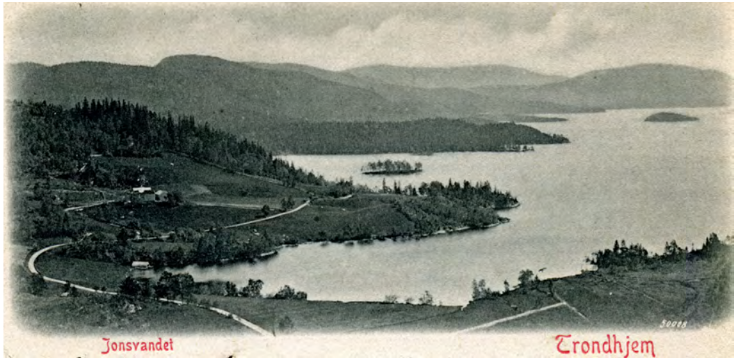
Nedre Jervan. Postkort sendt i 1902 - utlånt av Torbjørn Gimnes.

står imidlertid rett på, og den kan vinters dag være strid nok, også for veifarende. I gamle dager var for øvrig denne bukta en typisk gjeddevik, med gode muligheter for storfangst. Nå er det dessverre like tomt her som i de mange andre gode gjeddevikene rundt Jonsvatnet.