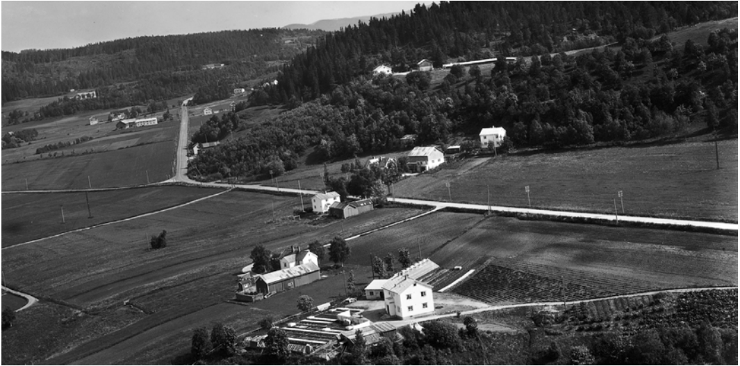
Blekkansvingen. I forgrunnen er Dalheimområdet med gården Stokkenget nærmest og Tunet, Engen og Østengen bak (se Årbok 2008).

Blekkansvingen i kombinasjon med Presthusveien, var ingen enkel løsning på et veikryss. På grunn av at traséen til den gamle Jonsvannsveien lå betydelig høyere enn Presthusveien, ble det her en kneik i veibanen som gjorde det vanskelig for kjøretøy som kom fra Presthusveien og skulle til Jonsvatnet. De fikk både en 120 graders sving og en liten oppoverbakke å hanskes med for å komme seg inn i Jonsvannsveien.