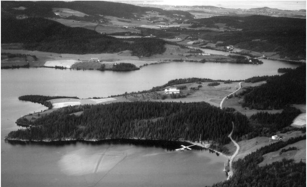
Utsikt vestover i 1936. Valsetbukta med flyhavna i forgrunnen. Småbruket Valsetbakken er til høyre for bukta - der husfildsskolen etter 1947 holdt til i bygningene etter tyskernes rekreasjonslasarett.

Ikke lenge etter at vi har passert Roborg og Jonsborg, kommer vi til den vestlige del av Valsetbakken. Gården Valset, som har gitt navn til både den vestlige og østlige del av Valsetbakken, ligger på bakketoppen til høyre for Jonsvannsveien. Den har fått dette navn fordi den ligger på åsryggen rett opp og like nord for det smale og grunne eidet som skiller Litjvatnet fra Storvatnet. Slike smale vanngjennomløp kalles valer, slik også med denne. Gården har for øvrig også gitt navn til begge bakkene, både den