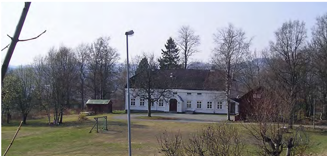
Berg prestegård sett fra Jonsvannsveien i 2004.

fine stuebygning i såkalt ”sorenskriverstil”, bygget i 1857. Den har - så lenge jeg kan huske - vært en typisk lokal stedsangivelse eller referanse på veien opp mot Jonsvatnet. Nå benevnes den ikke lenger med sitt rette navn, men Jonsvannsveien nr. 45. Dette sier oss egentlig lite eller ingen ting om hvilket praktbygg som skjuler seg bak dette tallet.