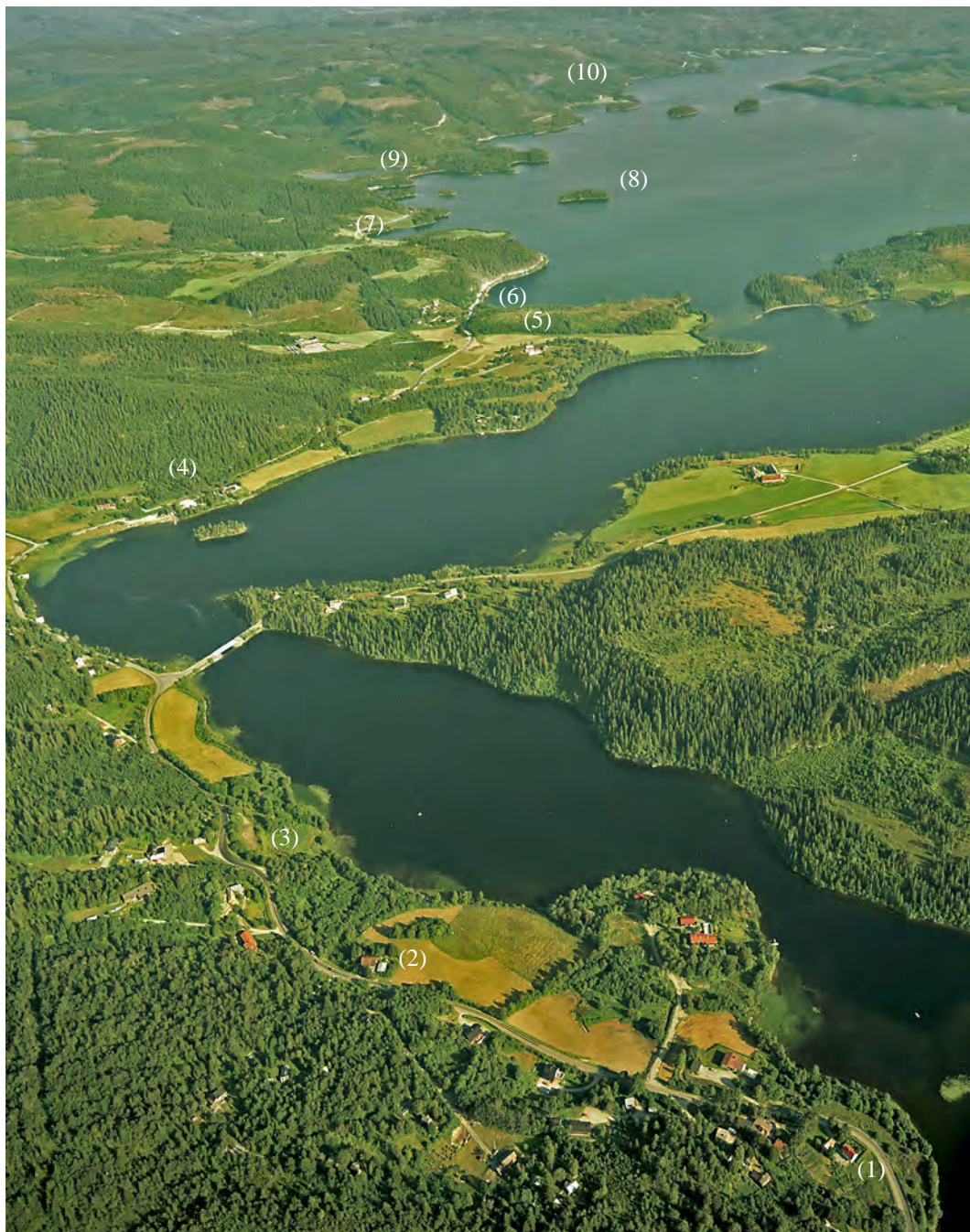
Jonsvatnet i 1991. Vi ser Rotasvingen (1), Berget (2), der Solbakken skole lå (3), Roborg og Jonsborg (4), Valset (5), Valsetbukta (6), Nedre Jervan (7), Mølmannsøya (8), Kusset (9) og Øydal (10). Foto: Fjellanger Widerøe AS - nr. VF12549.