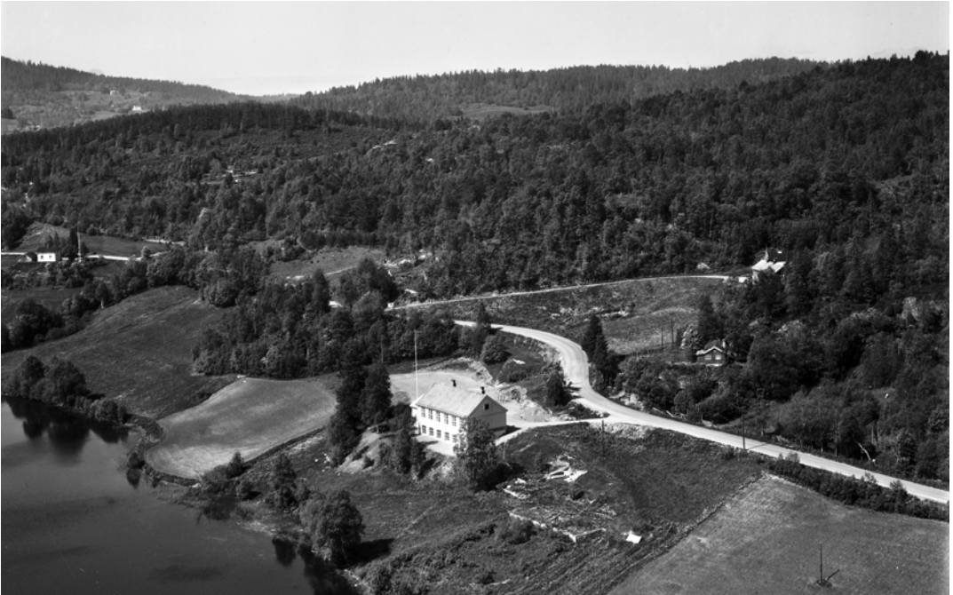
Solbakken skole i 1958 med skolebygningen fra 1924. I forgrunnen ser vi grunnmuren etter den opprinnelige skolebygningen, bygget i 1864.