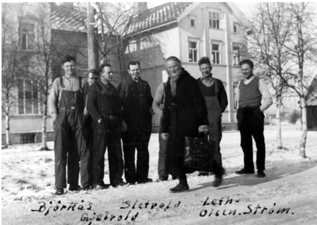
Elever og en forbipasserende på Brøsetveien i 1937. Foto og tekst på bildet: Per J. Mo.

Tredje etasje var kvistrom med rulle for glatting av duker og en del oppbevaringsrom for ting og tang. Hovedbygningen hadde fire gavler der det ble innredet elevrom. Det var plass for 5 elever på hvert rom. Ikke akkurat noe luksusliv. Skolen hadde altså elevplass for 30 elever, men bare soveplass for 20. Dette problemet ble løst ved at det alltid var menn fra nærmiljøet som ble opptatt som elever. De kunne bo heime. Dessuten ble det leid en del hybler så behovet ble dekket.