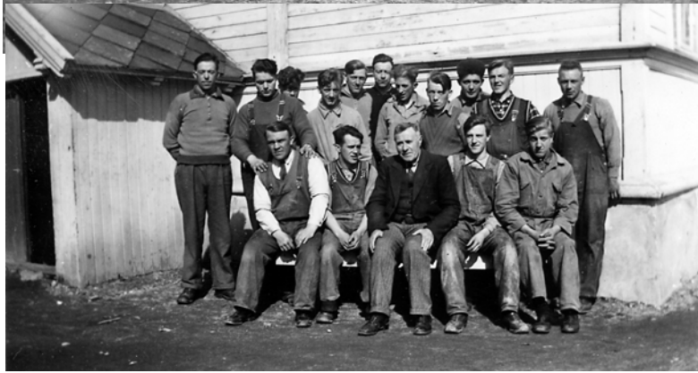
Smedavdelingen og snekkeravdelingen 1938-39 - med lærere.