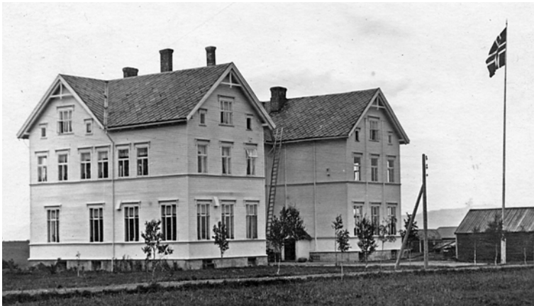
Moholtan høvsten 1934