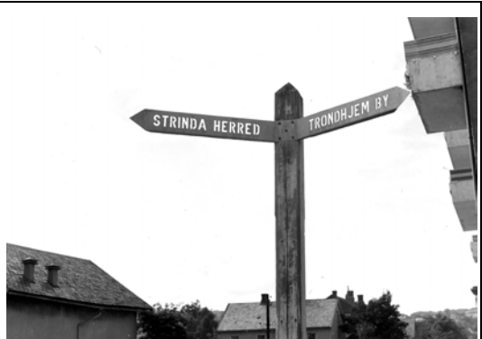
Vegskilt ved inngangen til Prof. Brochs gt. - markering av grensa mellom Strinda og Trondheim. Foto: Ragnvald C. Knudsen, 1962.

O. Alstad: Trondhjemsteknikernes matrikel 1870-1915, Trondhjem 1916. E. Hoffstad: Illustrert norsk næringsleksikon, bd. 3, Oslo 1940. Trondheim Adressebok 1941. Trondheim Energiverk, tegningsarkivet. Trondheim kommune, byggesaksarkivet.