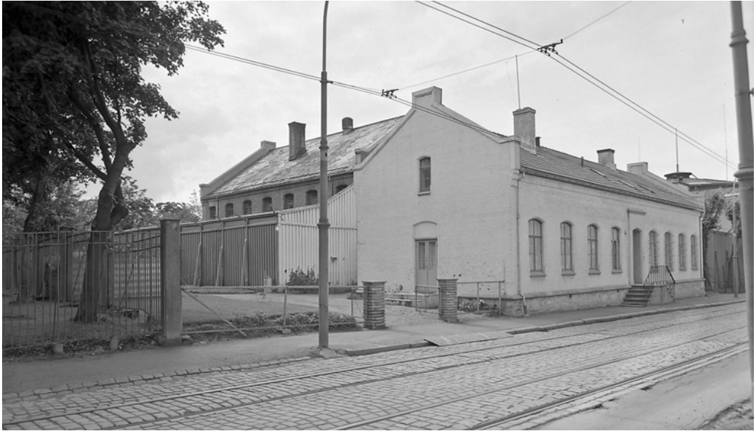
Vollan fengsel 1950 sett fra Klostergata.

veggen. Noen er opptatt med å løsne skolisser, bukseseler og belter. De har kommet like før oss. Tysk ordenssans blir forstyrret idet vi kommer inn.