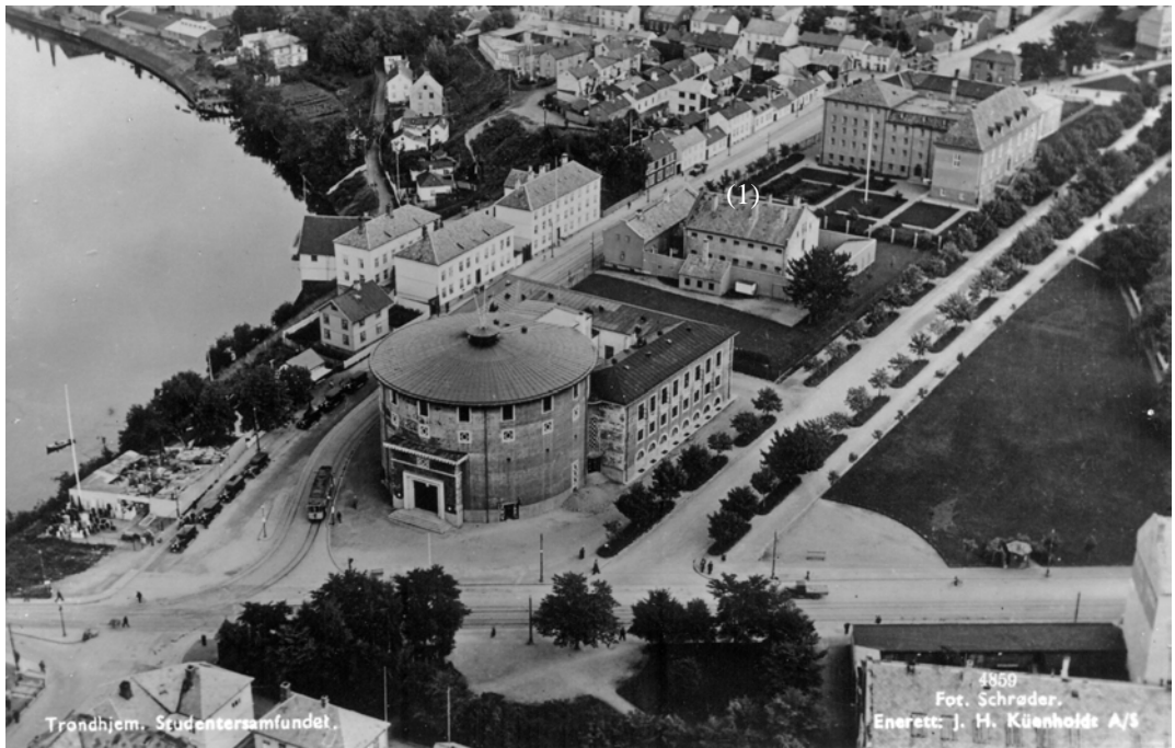
Vollan fengsel før krigen. Fengselet er bygningene bak Studentersamfundet (1).

Det er Vollan Kretsfengsel. Vi føres inn gjennom en gang til et stort rom. Der inne står det en masse mennesker langs