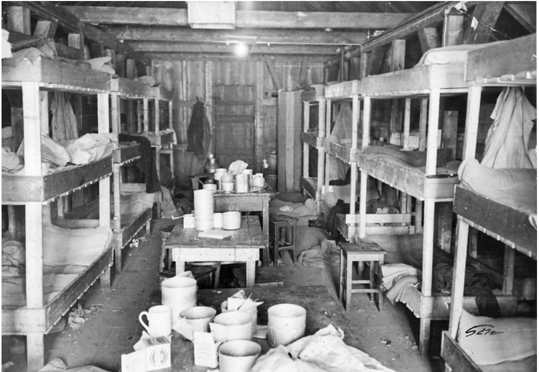
Fangerom i brakke på Vollan fotografert i 1945.