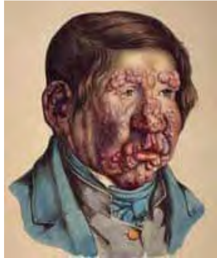
Bilde av spedalsk gutt, 13 år, i Lostings ill. lepraatlas. Lepramuseet St. Jørgens hospital/ Bymuseet i Bergen.

Slik innledes en artikkel i Trondhjems Adresseavis 21. september 1861. Artikkelen peker på denne "skrækkelige" sykdommen som var blitt en sann plage både for de stakkars menneskene som ble rammet av den og for omgivelsene. For ikke å være til plage fant mange av de spedalske ingen annen utvei enn å søke ly i usle små hytter nær stranden. Der levde de i sin ynkelige ensomhet avsondret fra andre mennesker, uten pleie,