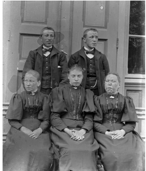
Unge pasienter på Reitgjerdet. Kanskje er det deres konfirmasjonssøndag? Stunden er preget av alvor og høytid, men sikkert også av en viss glede og stolthet over de staselige festantrekene som de har fått sydd til anledningen.

Tross betenkeligheter fant man derfor ut at trykket måtte lettes og hjemmebesøk tillates når pasientens helse stod på spill.