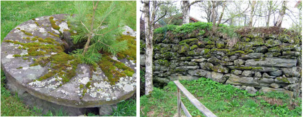
Rester etter møllebruket i Stokkbekken ved Solsletten.