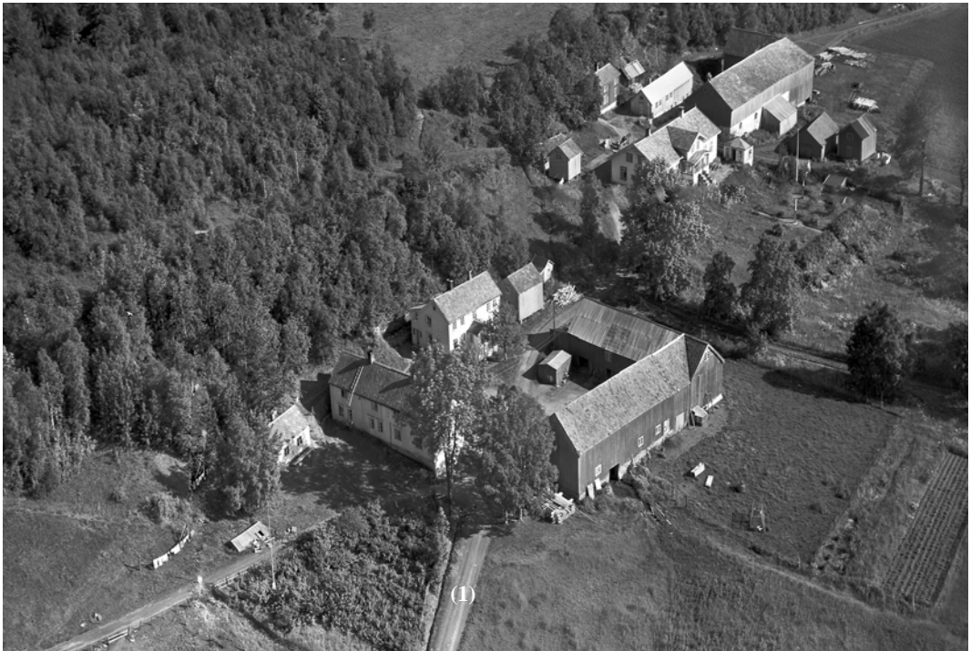
Nedre og Øvre Stokkan 8. juli 1952. Det var mange hus på Stokkangårdene da. Vegen (1) i forkant midt i bildet er bygdevegen mot Jonsvatnet. Denne vegen fortsatte langs kanten av Stokkhaugen. Vegen til venstre går opp til Stokkhaugen.