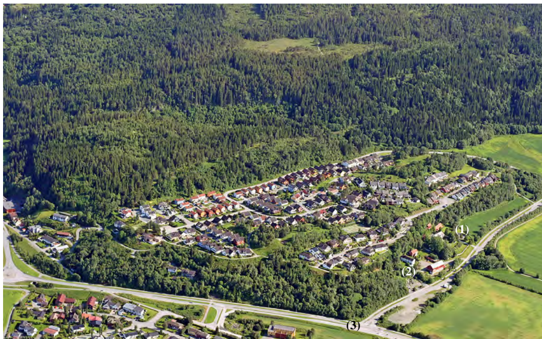
Stokkanområdet 31. juli 2011. Vi ser Øvre Stokkan (1), Nedre Stokkan (2) og ny del av Jonsvannsveien (3) - med samme trasé som den gamle bygdeveien mot Jonsvatnet.