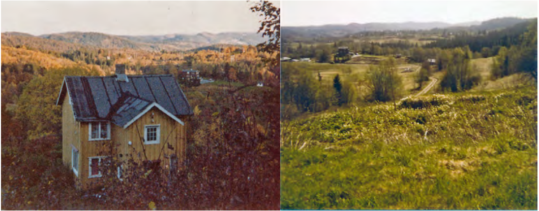
Stokkåsen på 1960-tallet.