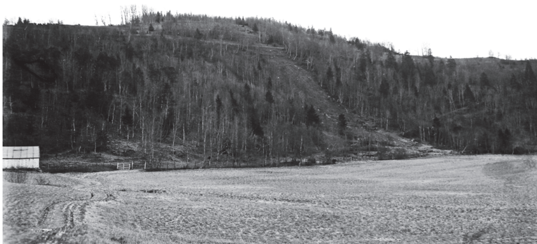
Store Stokkleiva i 1931. Øverst: Dugnadsgjeng i arbeid. Den gangen stilte man gjerne i slips til dugnad! Nummer 3 fra venstre av de stående er Ditlev Melhus og nr. 6 er Magnar Stendal. Nederst: Bakken og området rundt.

skiklubb, ble nr. 2 og satte bakkerekord. Avisene oppgir den til 65 meter, mens i en oversikt over bakkerekorder i desember 1936 oppgis den til 67,5 meter, med