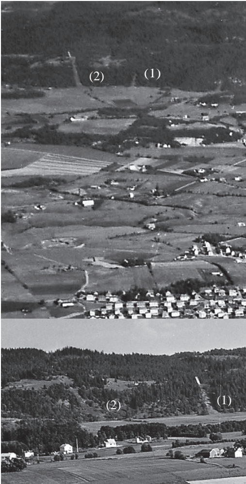
Lille (1) og store Stokkleiva (2) i 1936 (øverst) og i 1958.