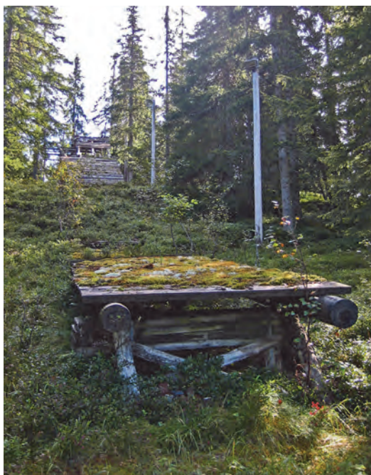
Pålskollen i dag. Det er den eneste bakken vi har funnet, hvor det fremdeles er rester av treverk. Den kan stå som symbol på forfallet i hoppintereessen.

sjonalt nivå på 60-tallet. Litt av en prestasjon!