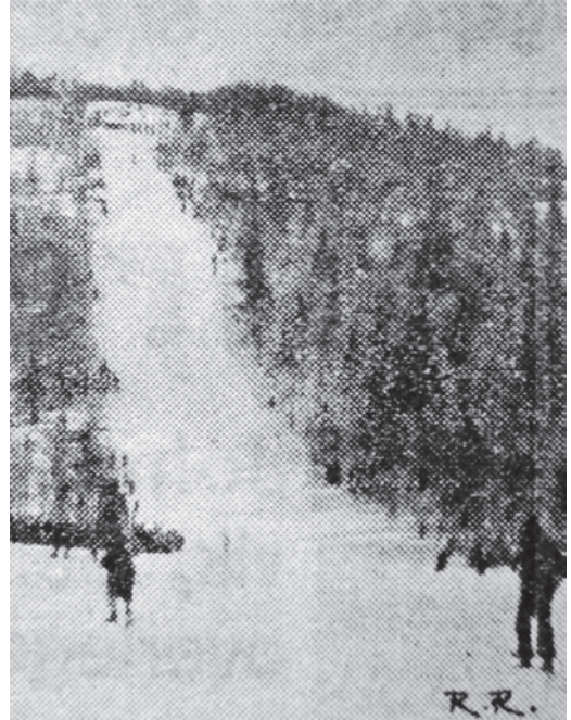
Store Stokkleiva under det eneste rennet som ble holdt i bakken, 31. mars 1935. Ifølge avisreferat var der 2000 tilskuere, men bildet gir et annet inntrykk.

Dette var en bakke som ble brukt i Strinda idrettslags tidlige liv. Den var også i bruk etter krigen. Bakken hadde fartsbru, hopp og dommertribune av tre. Det kunne hoppes rundt 30 meter i bakken. Strinda AIL avholdt gutterrenn der i januar 1946, med 60 deltakere. Det ble neppe avholdt renn der etter 40-tallet, men bakken ble brukt til trening til utpå 50-tallet. Den er forlenget gjengrodd.