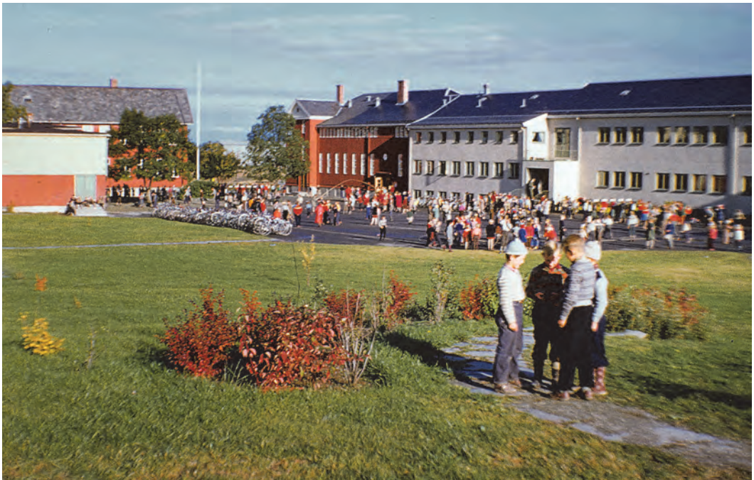
Bildet viser skolegården i et friminutt i 1955, og vi ser hoppetauet i full sving. Skolegården hadde asfalt, og der sprang vi 60-meteren og kastet stor og liten ball når vi skulle ta idrettsmerket. Vi hverken satt eller gikk på gresset, tro om det var forbudt? Vår del av det lysegule nybygget var til høyre, utenfor billedkanten.