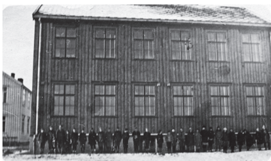
Åsvang skoles nybygg i 1927.