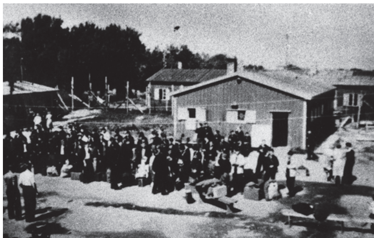
Bilde fra Rotvoll leir ved jugoslaviske fangers avreise 21. august 1945. Kopi utlånt av Michael Stokke ved Narviksentret.