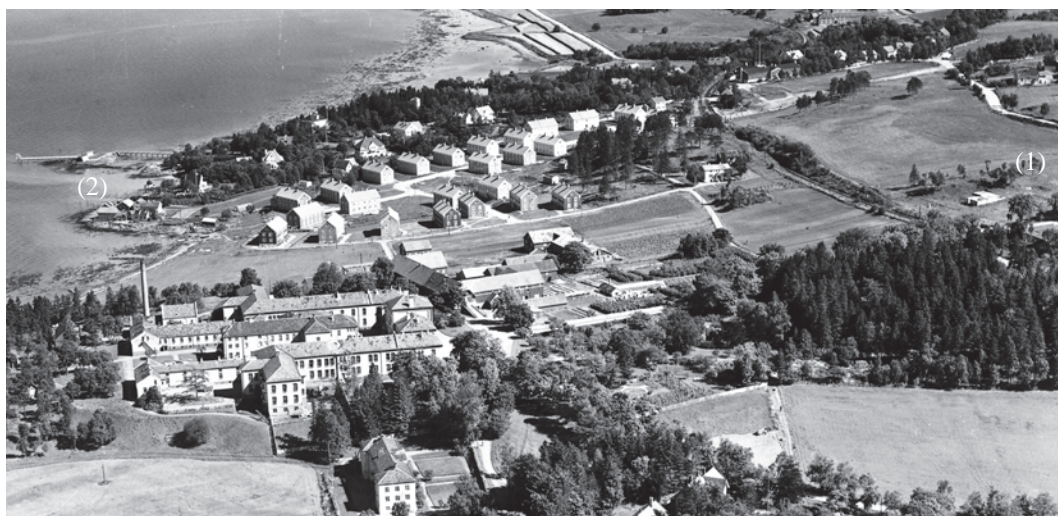
Rotvoll sykehus og Nedre Charlottenlund ca. 1950. Fangeleiområdet er til høyre (1) og Fagernes til venstre (2). Til høyre for Fagernes ligger bolighusene i Sjøveien - bygget under krigen for familiene til offiserer i den tyske marinen.

Utsnitt av flyfoto tatt av K. Harstad kunstforlag. Kopi fra www.flyfotoarkivet.no .