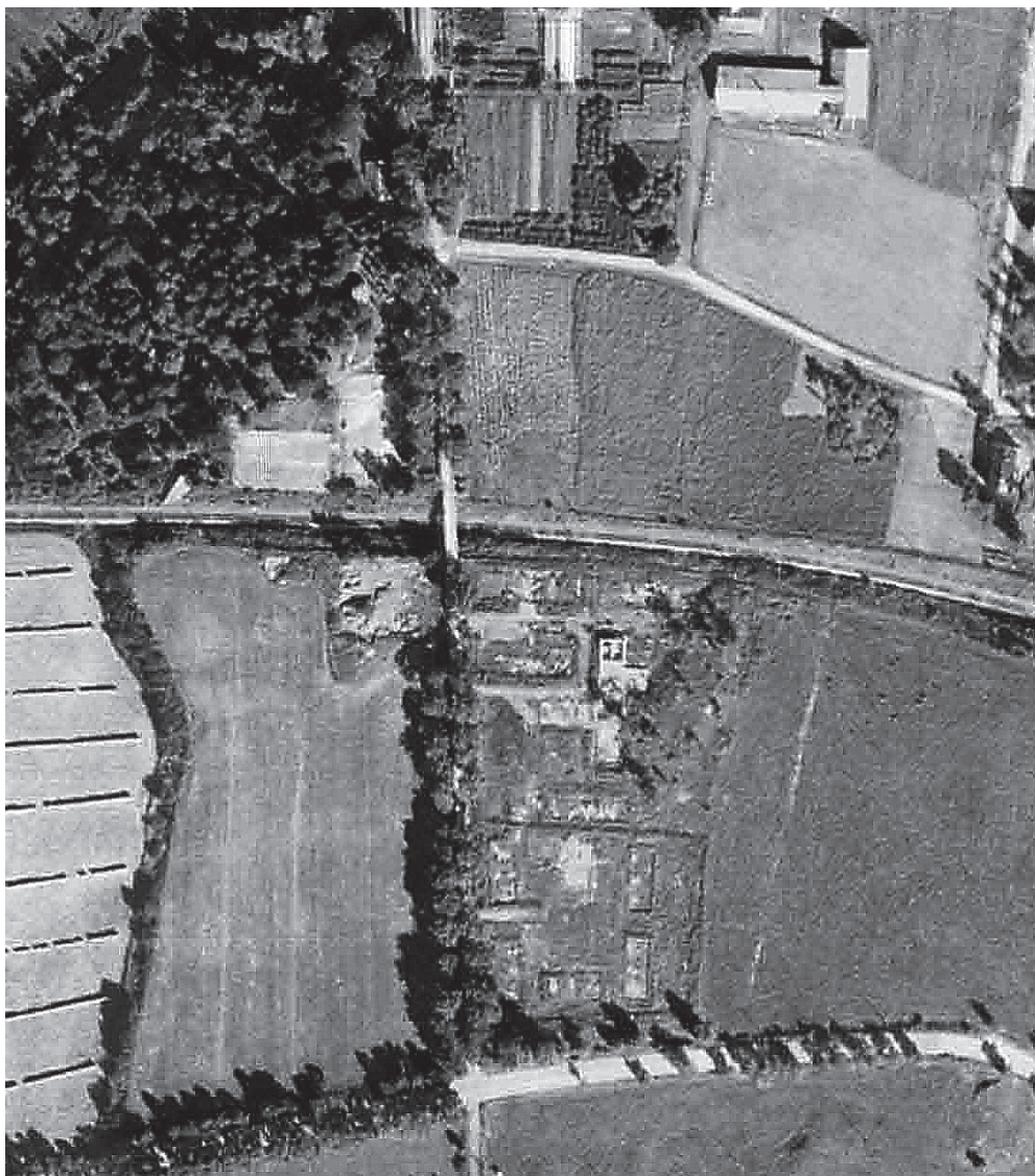
Leirområdet ved Rotvoll langs Schmettows allé, mellom riksvei 50 nederst i bildet og jernbanelinja midt i bildet. Øverst er Rotvoll sykehus. Bildet viser merket etter 11 brakker. Utsnitt av vertikalfoto fra 1947.

lay kom til Strindheim før 23. april. Dette er nok det nærmeste vi kommer et svar på spørsmålet.