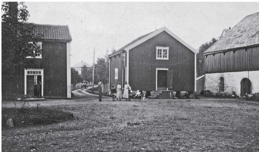
Gårdsplassen i 1933. To av sogneprest Holck Swensens døtre er på besøk.

Uthusene ble også modernisert. Fjøs og stall ble sementert og fikk ny innredning. Gjødselrommet ble sementert, og høylåven ble forlenget med 11 m.