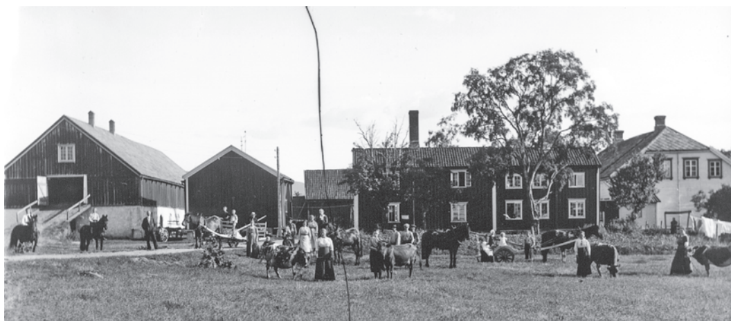
Bilde fra 1900-10. Det er mange som skal til for å drive en prestegård.

milien. De hadde alle solide kunnskaper og ble kalt “de syv vise”.