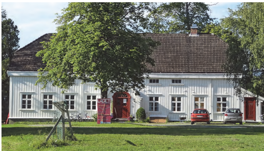
Berg prestegård i 2014 - en staselig og velholdt bygning.

Stedsnavnet Berg knytter seg antagelig til terrenget rundt gården. Gårdstunet og den tidligere hagen ligger på et platå med en vestvendt helling foran og en bergrygg bak. Navnet brukes i dag om villastrøket øst for Gløshaugen som er