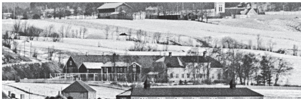
Prestegården etter prost Castbergs ombygging ca. 1920. Vi ser arken som ble påbygget på hovedhusets hageside. Bildet er et kraftig forstørret utsnitt av et bilde tatt i 1930 - fra Byåsen.

Strinda, var han sjømannsprest i New York fra 1901 til 1911.