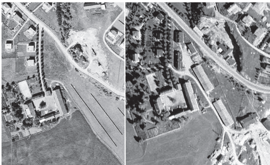
Vertikalfoto 1937 (venstre) og 1947 (høyre). Jonsvannsvegen krysser bildet. I 1937 er det oppført boliger ved alléen. I 1947 vises ved alléen og gårdstunet flere brakkeliknede bygg oppført under krigen. Noen av disse ble brukt til boliger en stund etter krigen.