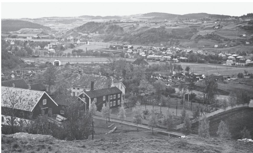
Prestegården i 1933. Langs innkjørselen ser vi bjørkealléen som Castberg plantet i 1919. Det er en tennisbane bak alléen! Bak prestegården ser vi kolonihagene på Lerkendal.

fem store brakker, verkstedbygninger, sagbruk og skur. I brakkene bodde bl. a. tvangsutsendte polakker som arbeidet på jernbaneanlegget. Denne jernbanen ble ikke ferdig under krigen.