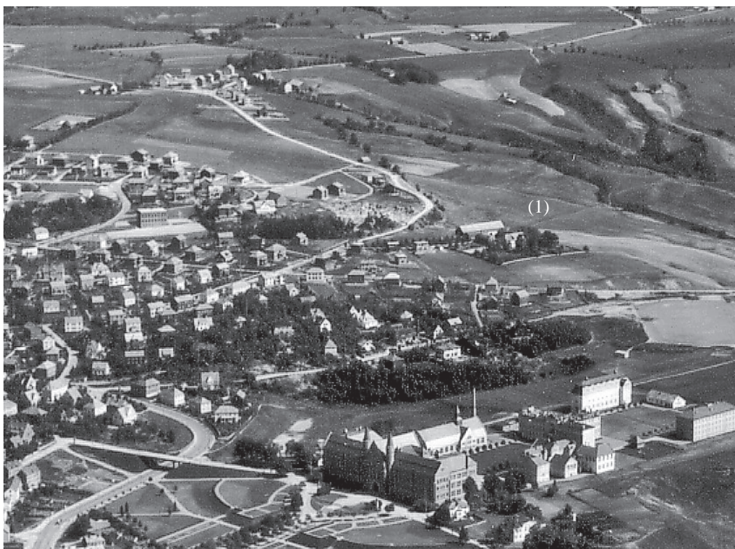
Berg prestegård (1) og omgivelser i 1936. NTH i forgrunnen. Utsnitt av flyfoto tatt av Widerøes Flyveselskap. Kopi fra Universitetsbiblioteket i Trondheim.

utparsellert fra den gamle prestegårdens innmark. Kommunegrensen fram til 1964 mellom Trondheim og Strinda kommuner avgrensner den tidligere jordveg mot vest. Gården har vært delt og jorden utparsellert i flere omganger, slik at det i dag bare er et mindre område omkring husene som hører til eiendommen.