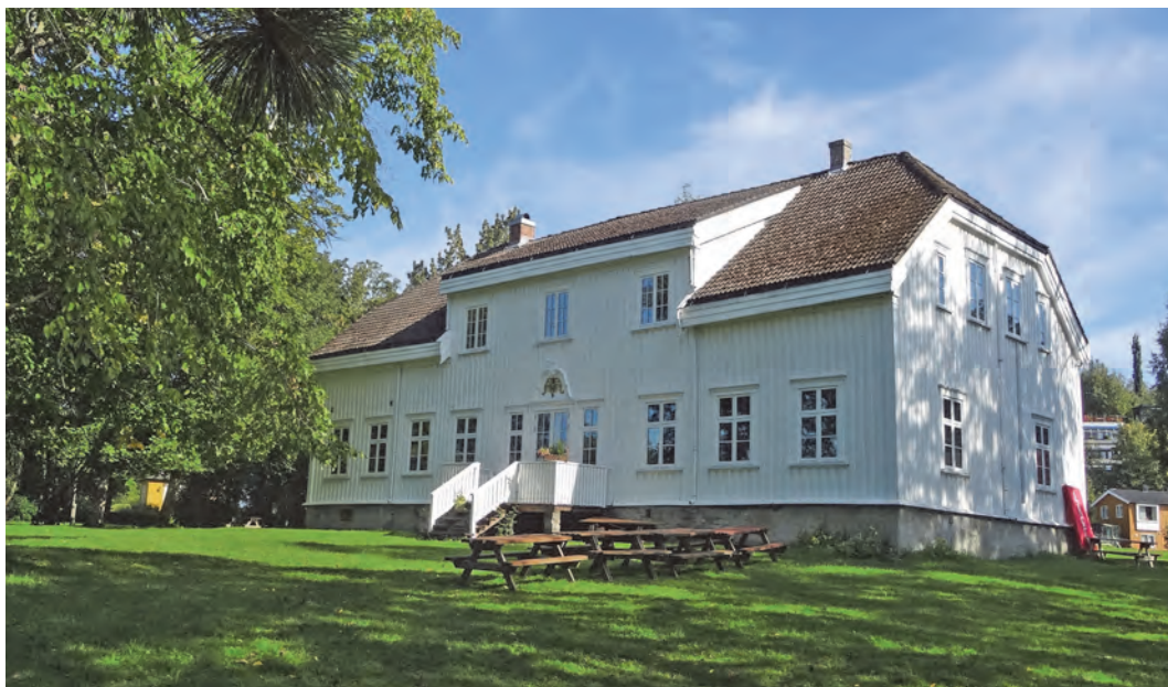
Berg prestegård - hagesiden - i 2014.