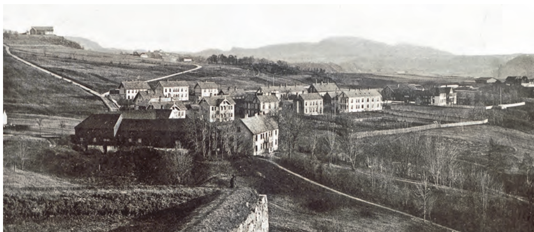
Utsikt sørover fra Kristiansten i 1880. I forgrunnen ser vi Lillegården og bakenfor hus i Øvre - og Nedre allé, og til høyre for disse ser vi Singsaker gård. Helt til høyre skimter vi Gløshaugen. De to veiene er Jonsvannsvegen (til høyre) og Bergsbakken, og gården oppå haugen til venstre er Øvre Berg.