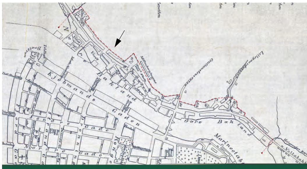
Utsnitt av kart fra 1847. Den røde stiplede linjen (se pil) er bygrensa etter 1. januar 1847. Kartet er laget for å vise hvor bygningsloven fra 1845 for Trondheim skulle gjelde - hvor nye bygg måtte bygges i mur.

til byen på Baklandet, var omtrent så brei som Bybrua er lang. Likevel var det ganske så tettbygd. I nord gikk grensen mellom Bakke kirke og Bakke gård langs den bekken som rant der Nonnegata nå går. Dermed kom de to skipsverftene ved Bakke inn i byen. Loven av 20. september 1845 trakk opp grensene.