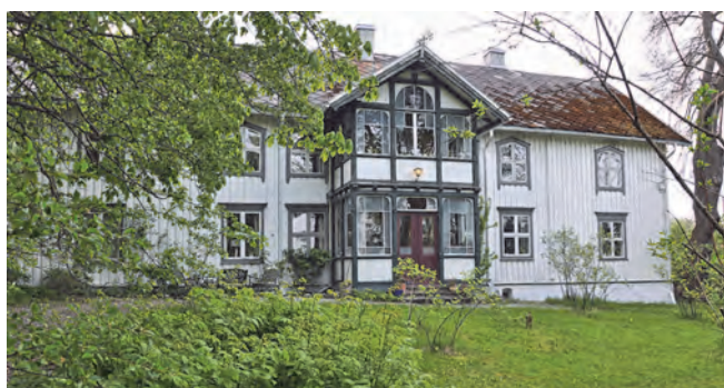
Lillegården i dag sett fra hagesiden.

nant Carsten Schjødt Due, ervervet gården i 1864, ble denne familien de første fastboende på gården. Det er etter løytnanten Duedalen har fått navnet sitt.