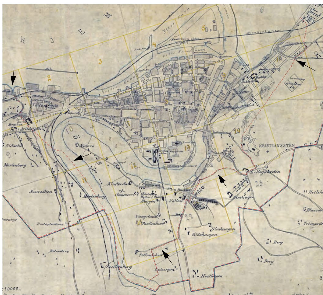
Utsnitt av “Oversigtskart over Trondhjem” utgitt av Stadsingeniørkontoret i 1893. Det viser “den gamle og den nye bygrense” - dvs. bygrensene fra 1. januar 1864 og 1. januar 1893. Pilene peker på grensen fra 1864. Den andre røde linja er grensen fra 1893.

Formannskap og bystyre hadde i 1859 sagt nei til forslaget fra Strinda. De ville ikke ”pånødes” noen del av Strinda. Men byborgernes synspunkter ble ikke tatt til følge verken av regjering eller storting. Loven om byutvidelse ble vedtatt i Stortinget 1. juni 1863. Utvidelsen skulle tre i kraft fra 1. januar 1864. (Se Årbok for Strinda historielag 2004 , hvor