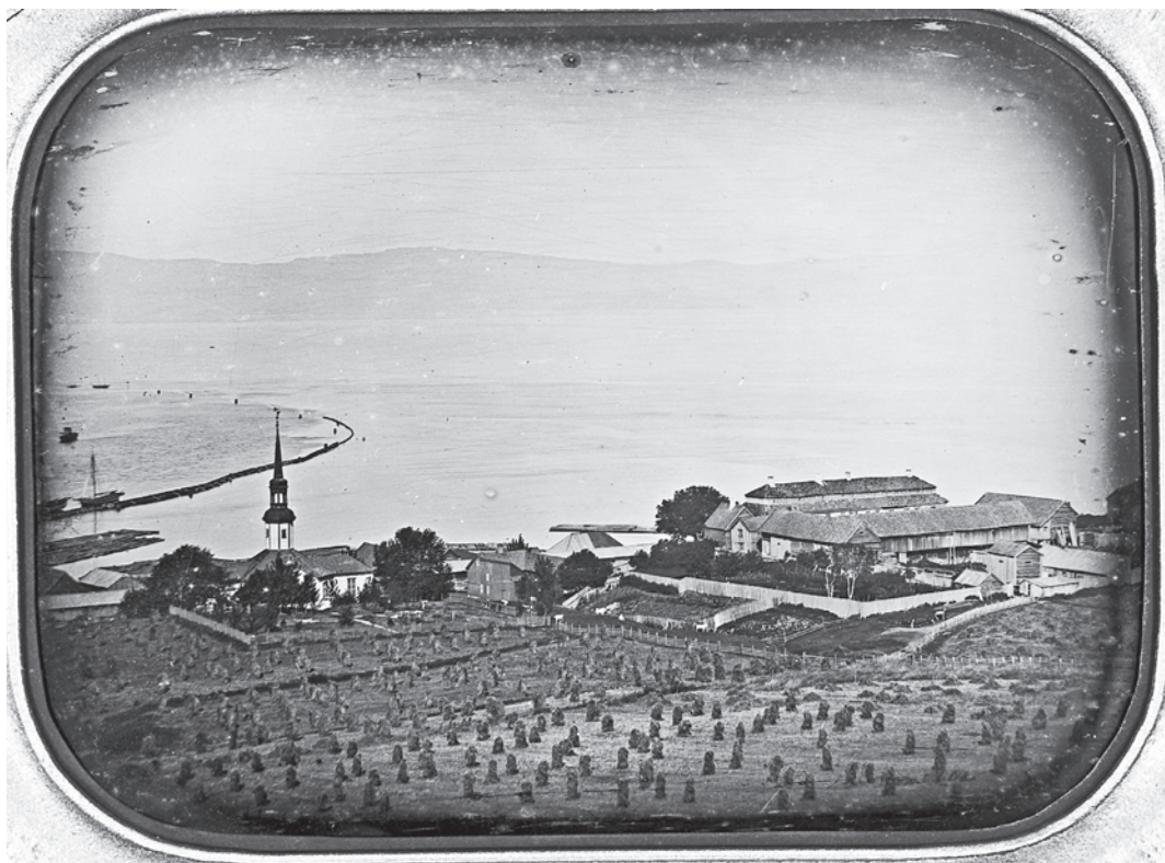
Daguerreotypi som viser Bakke gård og Bakke kirke på 1850-tallet.

hele lovteksten er gjengitt). Stortingsrepresentanten Einar Gram fikk med et tilleggsforslag flertall for at den nye bygningsloven skulle gjelde også for de nye områdene, samt i et ganske bredt belte utenfor bygrensene. Byens myndigheter jublet! Da ble det også murtvang der. Dermed ville Lade sogns fattigutgifter fortsatt stige.