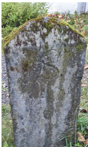
Etter 1864 gikk bygrensa rett bak husene på Lillegården. Bildet til venstre viser en grensestein fra 1864 som står bak stakittgjerdet på østsiden av husene. Merk S - siden mot Strinda. Gårdens jorder var fortsatt i Strinda. Ved grenseendringen i 1893 ble bygrensa flyttet østover til Lillegårdens grense mot naboeiendommene - til nåværende Overlege Kindts gate. Kartet s. 128 viser også denne grensa.

spiller selvfølgelig på åskammens utseende. Vi finner også navnet på en del gamle kart.