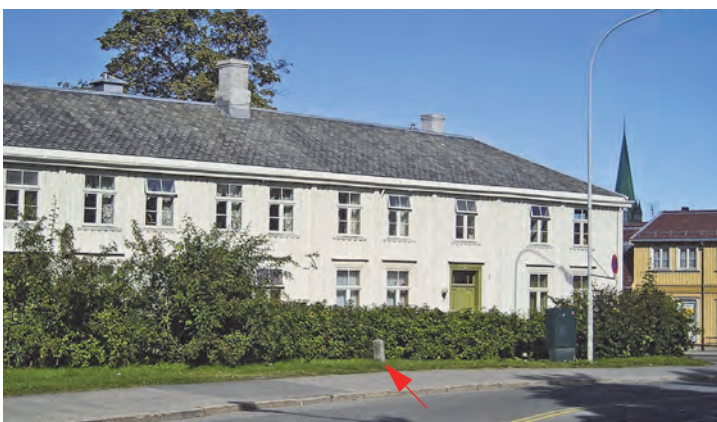
Elgeseter gård i 2004. Pilen peker på grensesteinen fra 1864.

vel å merke uten dom. De fattige forestilte seg denne institusjonen som langt verre enn Tukthuset. Anstalten kunne tjene penger ved at de "innsatte" deltok i gårdsarbeid på ulike plasser, og det er indikasjoner på at de "drikkefeldige" trivdes med tilværelsen på anstalten.