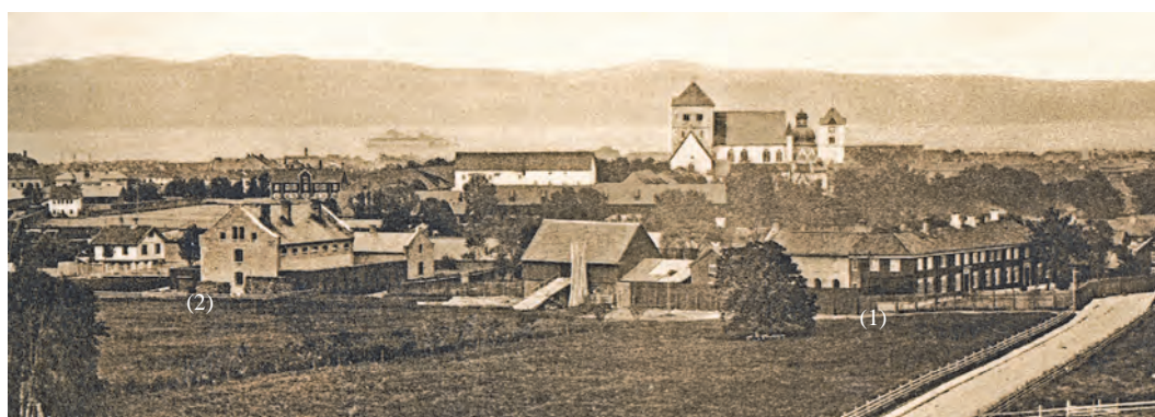
Elgeseter gård (1) og fengselet på Vollan (2) før 1875. I forgrunnen ser vi Klæbuveien. Fra boka Gamle Trondhjem i bilder utgitt av Albert Emil Kock, 1910. Kopi fra Universitetsbiblioteket i Trondheim.

Hvem var så målgruppen for tiltaket? Kommunen ønsket å anbringe "betlere, drikkfeldige og arbeidssky personer" -