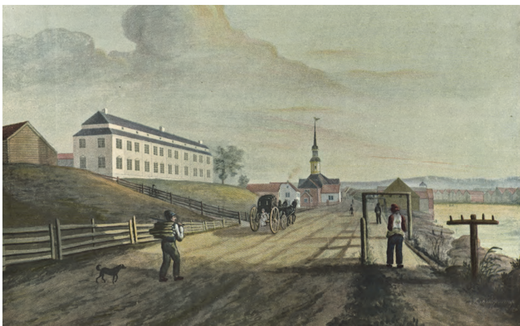
Gouache av Bakke gård av J. F. Rosenvinge 1821. Til høyre for vegen ser vi reperbanen på Bakkestranden.