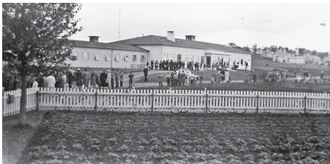
Trondsletten Cerebralparesehjem åpnes av Kong Olav V i 1956. En stor begivenhet.