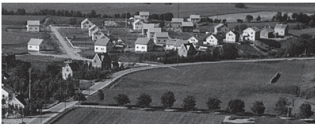
Hagebyen 8. juli 1952. Brøsetvegen går gjennom bildet. Åkervegen er øverst til venstre. I forgrunnen ser vi alléen inn til Reitgjerdet sykehus.

by, fordi det var det som var det korrekte navnet.