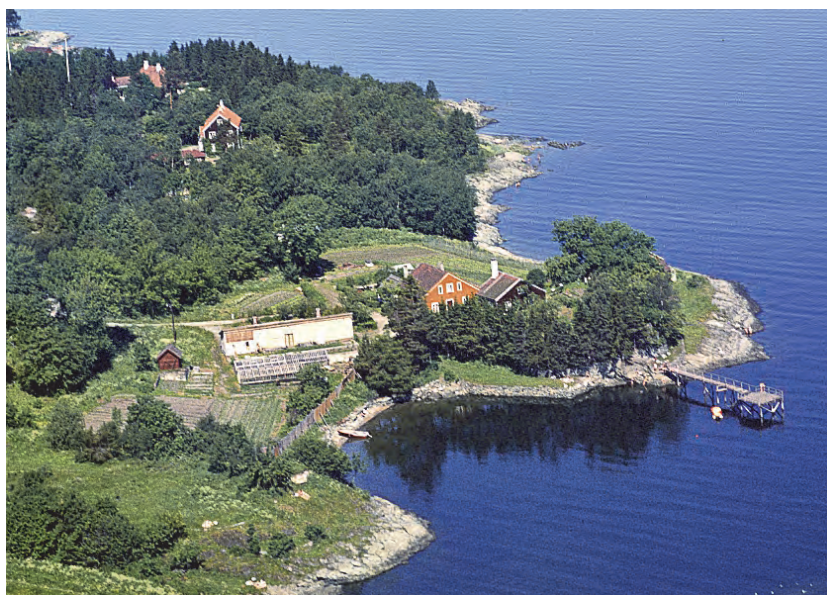
Dette oversiktsbildet fra 1960 viser gartneribygningen uten det opprinnelige veksthuset, men med drivhusbenker til bruk i et mer moderne handelsgartneri.

derne veksthus på sørsiden. Flyfoto fra 1960-tallet viser hvordan man den gang hadde drivbenker. Det originale veksthuset forsvant mellom 1955 og 1960, trolig etter å ha forfalt lenge.