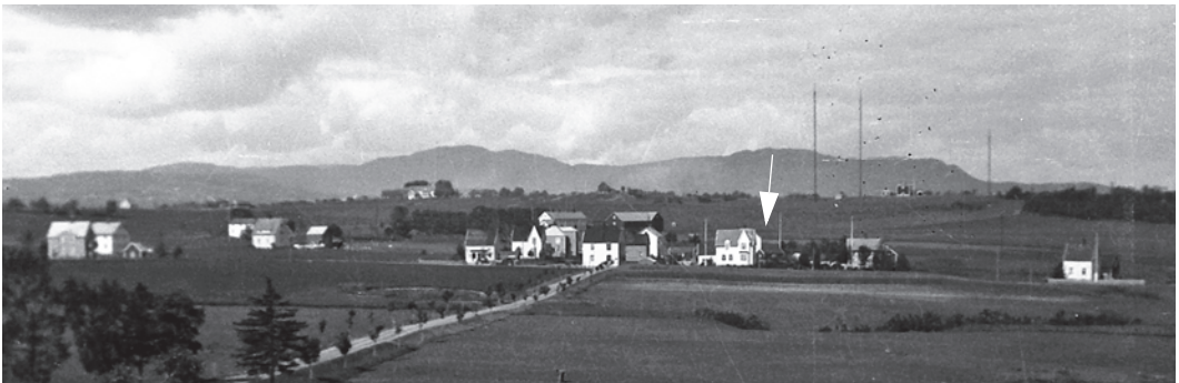
Brøsetflata fotografert fra Reitgjerdet i 1932. Vi kan skimte Einbu med flaggstanga bak det hvite huset med det spisse utbygget i 2. etasje (pil).

I nabolaget var vi mange unger som lekte sammen. En av «lekene» var å plukke granatsplinter etter at «faren over-signa-