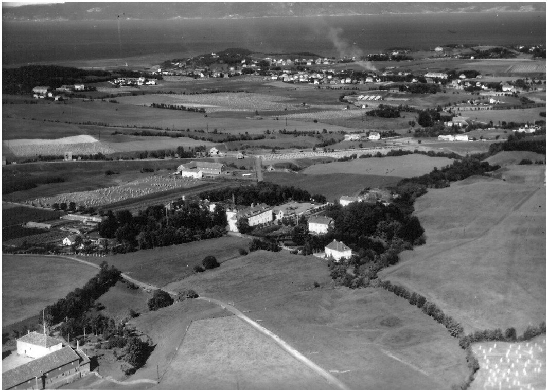
Flyfoto mot nord i 1936. Reitgjerdet i forgrunnen og Brøset gård bak. Nederst til venstre er Angelltrøa.

Sommers tid var det populært å få sitte på hesteryggen lørdag ettermiddag når hestene skulle i hamnehagen. Der hvor Brøset Hageby er i dag, var det bl.a. hamneområder og også åkerland. Vi lurte oss selvsagt til å hoppe i høyet når det var kjørt inn på låven, selv om vi ikke hadde lov og ble jaget vekk. Noen ganger gjemte vi oss i høyet, men hadde nok