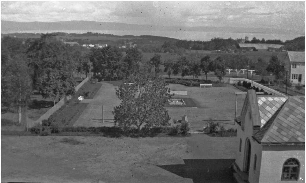
Parken på nordsiden av sykehusbygningen i 1932 med snekkerverkstedet til høyre og en del av bygningen hvor overpleier og kasserer bodde. I bakgrunnen til høyre er Tunga gård.

Om vinteren kunne vi bli frosne når vi lekte ute – vi hadde ikke så godt vintertøy den gang som ungene i dag. Bekkømsko og selbuvotter holdt ikke alltid kulda ute, men vi ville ikke “kaste bort