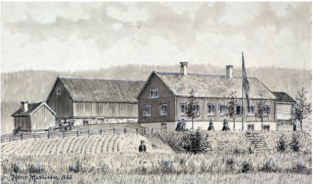
Loholt Søndre 1866. Øverst: Fotografi på glassplate. Nederst: «Loholt Søndre tegnet 1894 etter eget fotografi». Det lille huset til venstre var en smie.