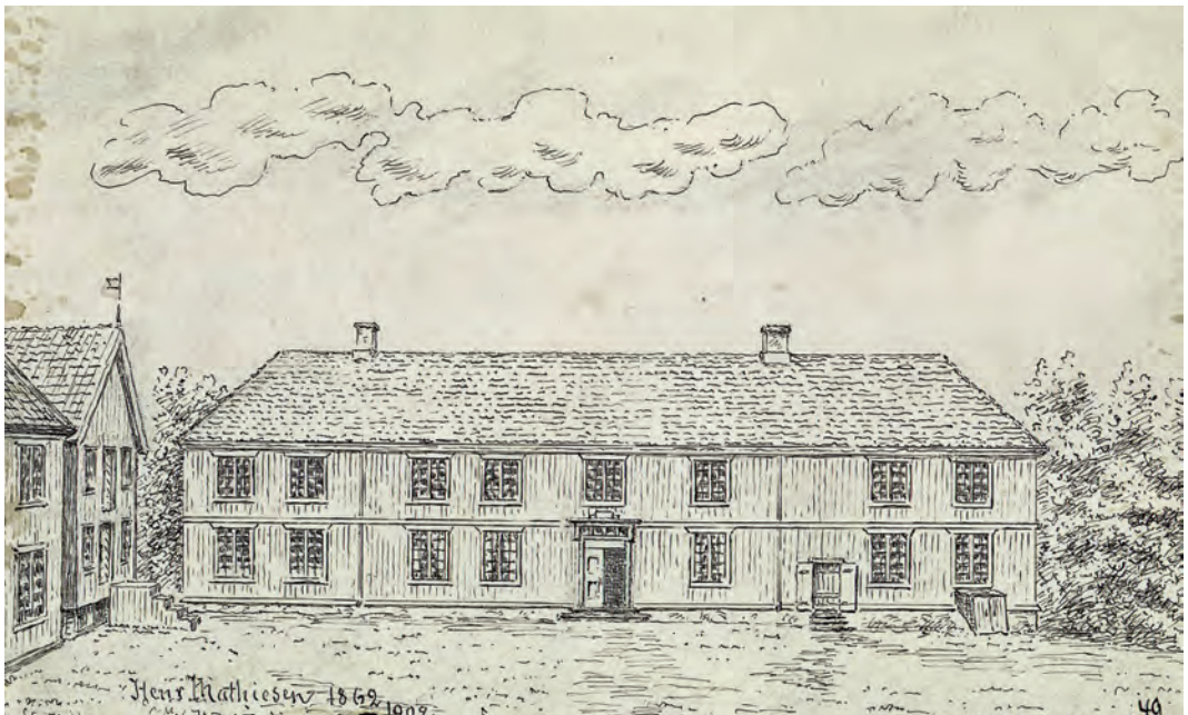
«Gaarden Moholt i Strinna. Skitseret 1862, tegnet 1902. Gården brant 1901».