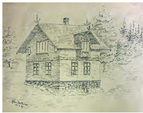
Til venstre: «Gaarden Amalienborg, Strinna tegnet 1874». Til høyre: Fagrabrekka i 1899. I dag er det en gate som heter Fagrabrekka på Ranheim.