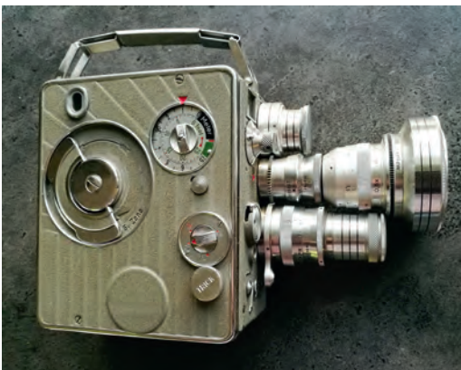
Nizo Helimatic – anskaffet ca 1954. Til høyre ser vi hvordan filmen måtte tres for hånd. Det måtte skje i mørke for å unngå lys på.