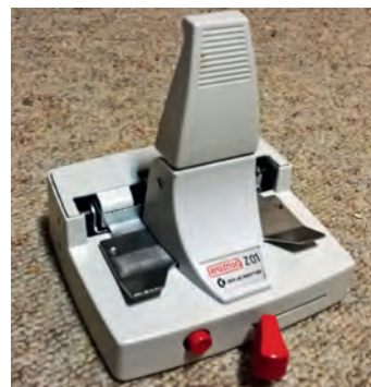
Spliseapparat - 8 mm til venstre og Super 8 til høyre.