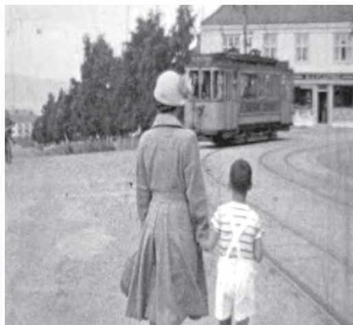
Fra Lillebrors verden – filmet i 1952.