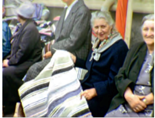
Fra Trondheimsfilmen som ble filmet i perioden 1953 til 1970. Matteselgere på Martnan.