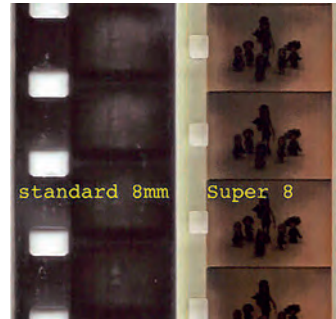
Til venstre: 8 mm smalfilm. Til høyre: Filmformater – 8 mm og Super 8.

8mm-formatet tok utgangspunkt i at man splittet en dobbeltperforert 16mm i to. Dette ble gjort under fremkallingen. Formatet ble introdusert av Kodak i 1932. Når man filmet, ble en 16mm-film lagt i kameraet. Man filmet først på den ene halvdel, og snudde så spolen for så å filme på den andre. Dette kunne være en krevende øvelse ettersom «snuoperasjonen» måtte skje i mørke for å unngå skjemmende lysflekker på filmen. Andre navn for formatet er Standard 8mm, Normal 8mm, Split 8mm eller bare 8mm.