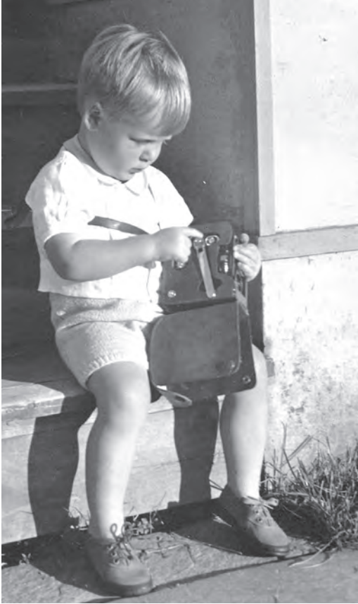
Artikkelforfatteren med Siggens aller første småfilmkamera.

Med interessen for turn fikk Siggen stadig nye filmmotiver. Det er ikke få meter med film som er viet livet i Turnhallen. I tillegg til filmer fra treningskvelder og konkurranser, ble utallige turnstevner i inn- og utland festet til filmrullene. Trondheims Turnforening markerte sitt 150-års jubileum i 2008. Tre år tidligere overlot jeg turnfilmene til foreningen, 15 filmer fra 1946 til 1987, alle filmene grundig redigert og tekstet. I skrivende stund vet jeg ikke om filmene er blitt vist eller digitalisert, men jeg regner med at de er tatt godt vare på.