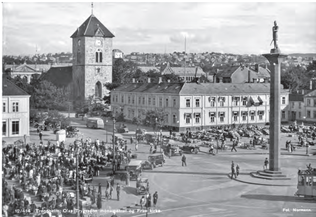
Torget med Hornemannsgården og torghandel rundt 1950. Postkort uttgitt av Normann kunstforlag.