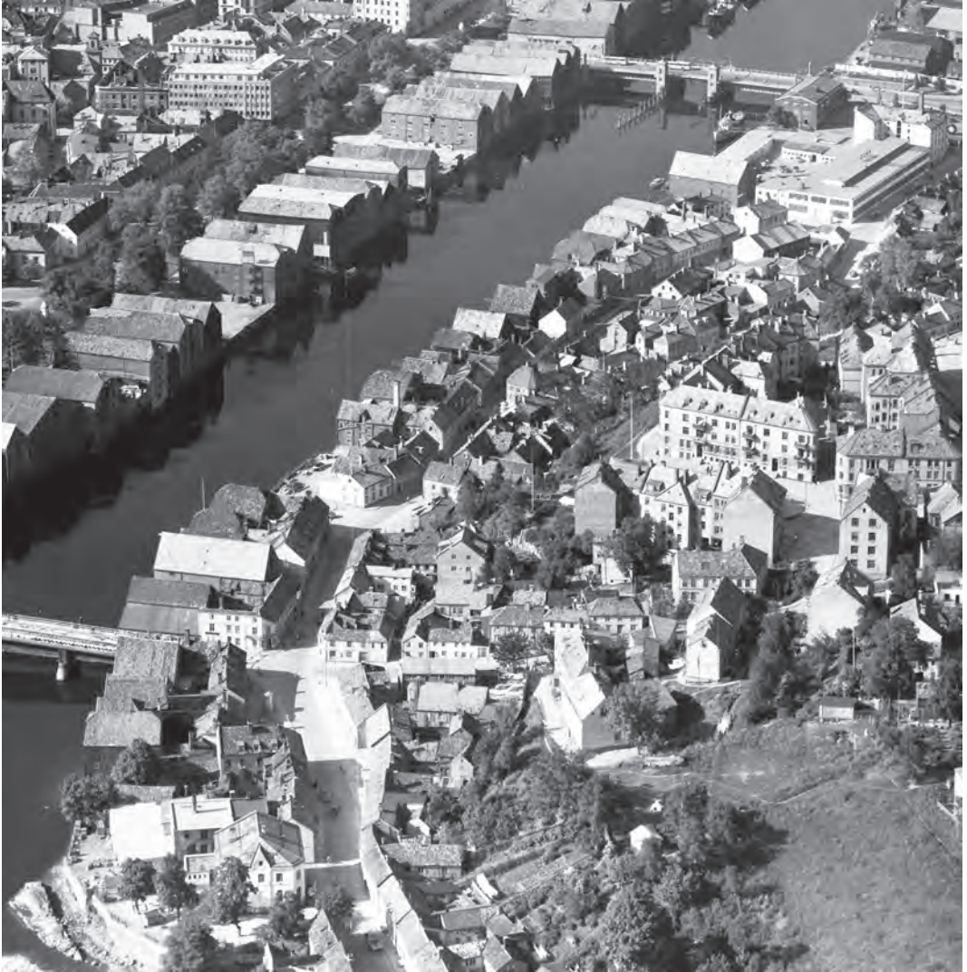
Bebyggelsen på Baklandet. Utsnitt av flyfoto fra 24. juni 1953. Trehusene er fra 1700- og 1800-tallet, og bryggene ble reist på begynnelsen av 1800-tallet og seinere.

Det ble også arrangert støttekonserter av velforeningen til inntekt for oppussing av okkuperte hus.