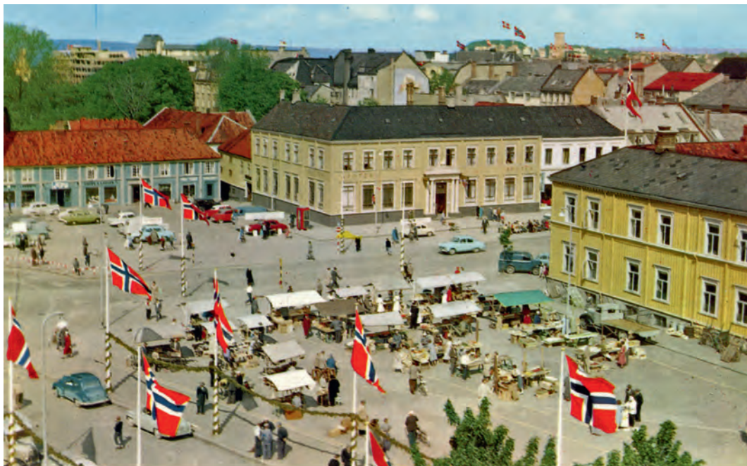
Torget rundt 1960 med torghandel og med Sommergården (Svaneapoteket) bakerst til høyre. Postkort utgitt av Aune kunstforlag.

førte til at Sommergården på folkemunne fikk navn etter apoteket. Da ombygginga var ferdig på 1830-tallet, ble det holdt en stor fest her for kong Carl Johan da han besøkte byen. Sommergården ble på nytt ombygd en del på 1930-tallet. Etter at det vakre bygget da hadde stått urørt i hundre år, fikk arkitekt Erling Gjone oppdraget med å senke golvet i første etasje og dermed gjøre det mulig å redusere trappeløpet ned mot Kongens gate. Det gjorde han på en fin måte.