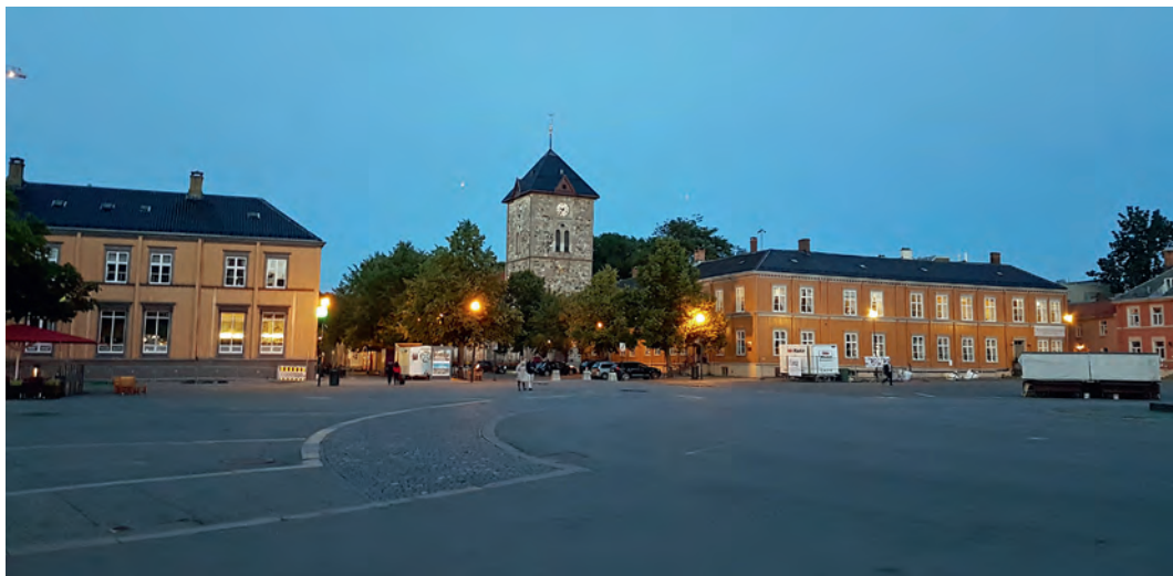
Østsida av Torget en kveldsstund i august 2017. Slik gikk det – bygningene og Torgets østvegg ble redda takket være protestene på 1970-tallet.

vegprosjektene gjennom Midtbyen, Ila og på Bakklandet ble sterkt problematisert på 1970-tallet.