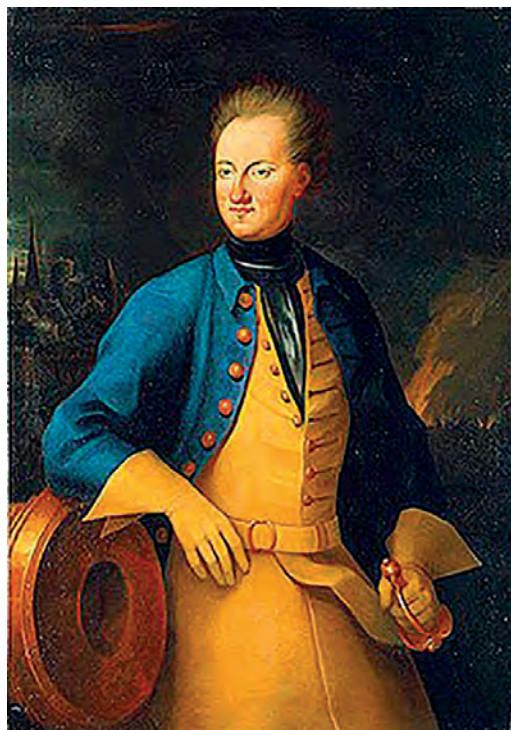
Karl XII av Sverige (1682-1718).