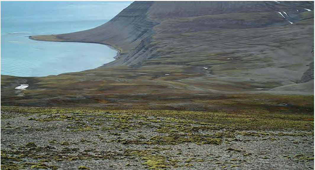
Heniesalen på Hopen.