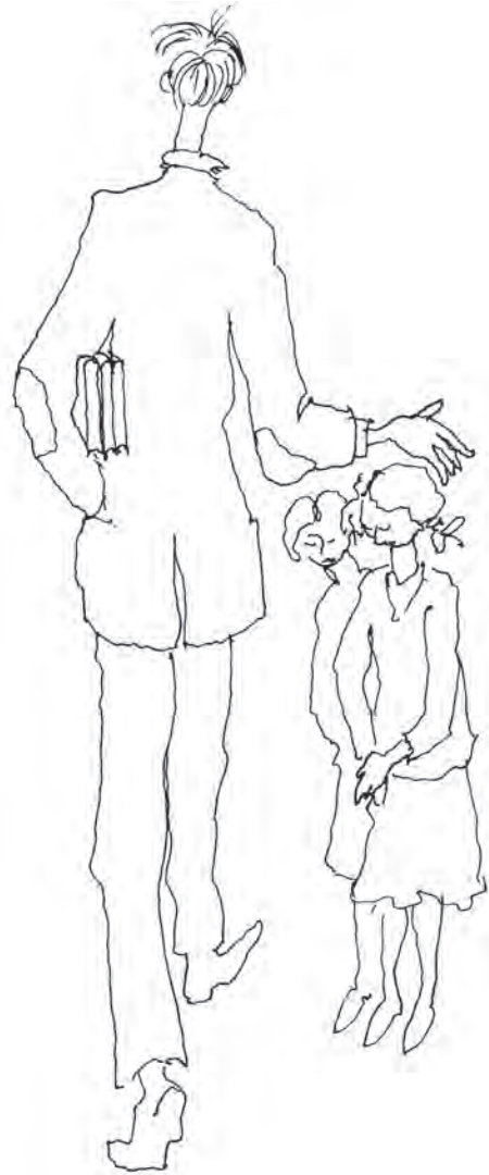
Tegning av Helge Ryvarden, 1974 (Fra «Lilje i blekkhus», 1986.)

La det gå som et brus gjennom gangene, barn: Han kommer med sol og sommer. For ingen kan være som han når han vil. Og ingen kan komme som han når han kommer.