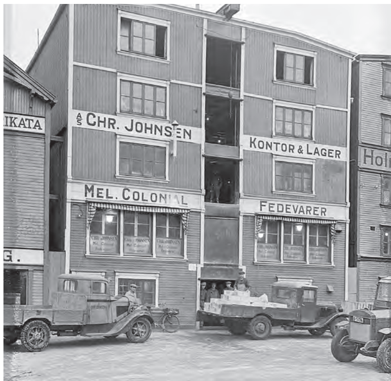
Chr. Johnsen's brygge i Fjordgata 52 ca. 1938. Firmaet startet i 1895.

første etasje som gjorde det mulig å rygge inn til lasterampen, var en praktisk tillempning til bilalderen – slik størrelsen på biler og trafikk var på denne tid. Men nissen, problemet med lager på flere plan, fulgte med på lasset. Kjeldsberg bygde senere nytt på Sluppen, og brygga har fått endret fasaden, slik at den nå gir et mer lukket, tradisjonelt inntrykk.