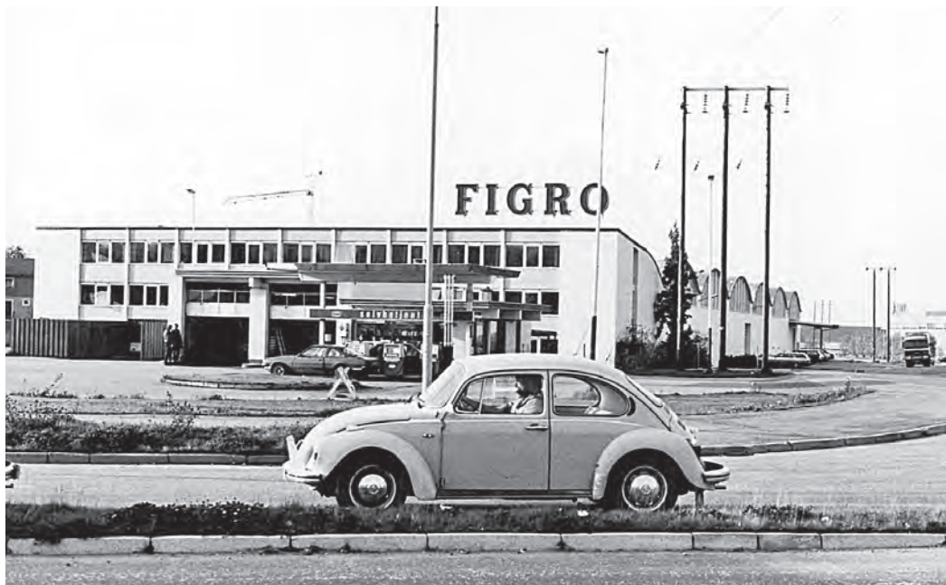
FIGROs bygg, trolig på slutten av 70-tallet.