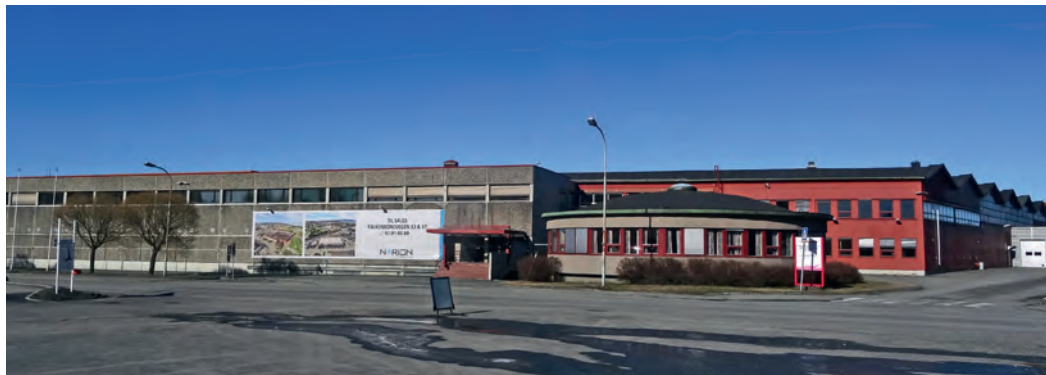
KØFF-bygget i april 2016. KØFF og FIGRO fusjonerte i 1986. I 2016 var begge byggene til salgs samlet. Det var en stor salgsplakat på bygget. KØFF-bygget er blitt utvidet etter 1962.