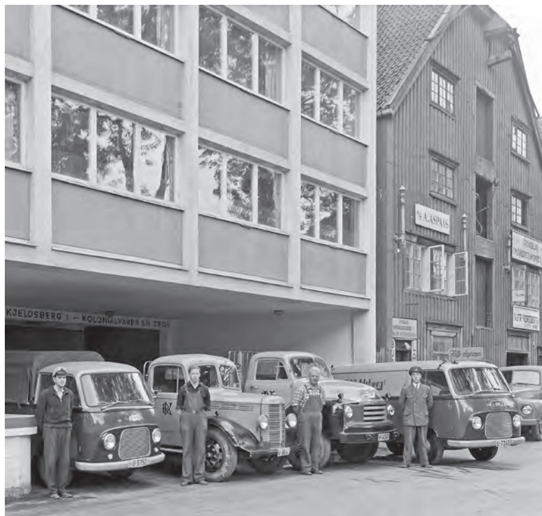
Kjeldsbergs nye brygge med bilparken. To Bedford, tilsvarende KØFFs og Bolland's (se s. 117 og 118), flankert av to Ford Köln FK 1000. Foto 1957: Schrøder-samlingen/Sverresborg Trøndelag Folkemuseum.

Fønstelien arbeidet en tid med mulighetene til å få oppført et lager og kontorbygg i Ravnkloa med fisketorvet i underetasjen: Man kunne på dette tidspunkt ikke tenke seg å oppføre et bygg utenfor sentrum. (Min kursivering). Denne planen var heldigvis ikke gjennomførbar. I forbindelse med at havnelageret ble bygget, forhandlet Fønstelien om å få leie 2. etasje. Han ble frarådet dette, da fremtiden måtte være å komme inn i eget bygg.