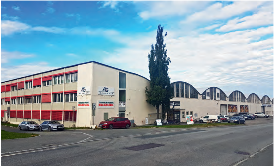
FIGRO-bygget i september 2019.

på den første festivalen, som utsendt medarbeider for Arbeider-Avisa. Nå var det spennende å kjøre hjem på natta for å rekke jobb mandags morgen. Etter ferieavviklingen, og på tross av enkelte tabber, fikk jeg lov til å fortsette utover høsten. Da ble det mindre tid bak rattet, mer som lagerarbeider og hjelpe-mann på bil.