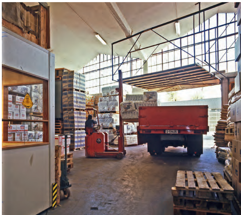
Faktorene for ettplanslageret: Gaffeltrucken og lastebilen. Fra brosjyren KØFF Engros A/S Nord 25 år 1950-1975.