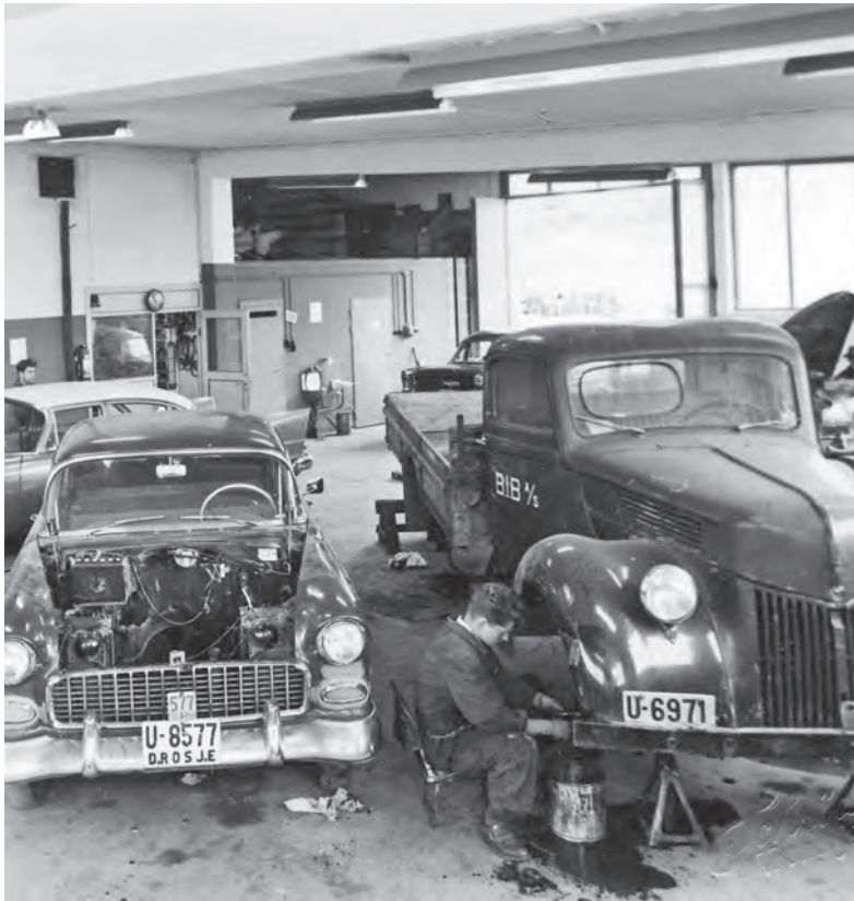
KØFF brukte Vinjes verksted. Her er gammel-Forden inne til sin kanskje siste overhaling, i selskap med Vinjes drosje Chevrolet 1955-modell. I bakgrunnen skimtes halefinnene på en Plymouth fra 1957-58, som kan antyde dateringen.

var den en verdig representant for den siste perioden med betydelig innslag av amerikanske lastebiler på markedet. Flatås var mer innadvendt, som kunne sømme seg en pasjonert laksefisker med vall i Gaula.