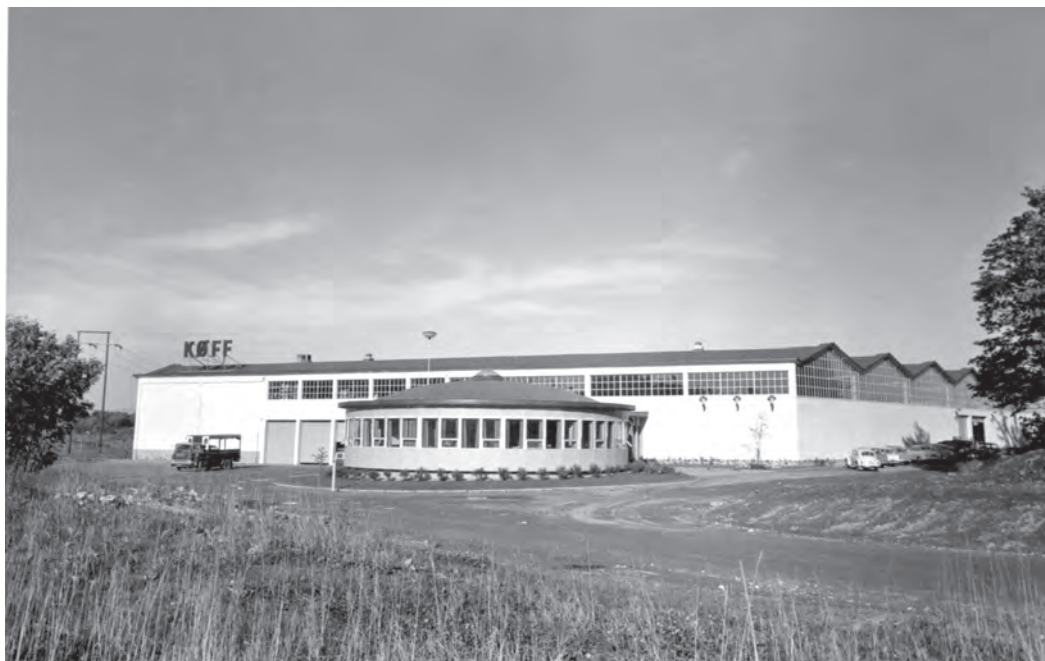
KØFFs nybygg i 1962.