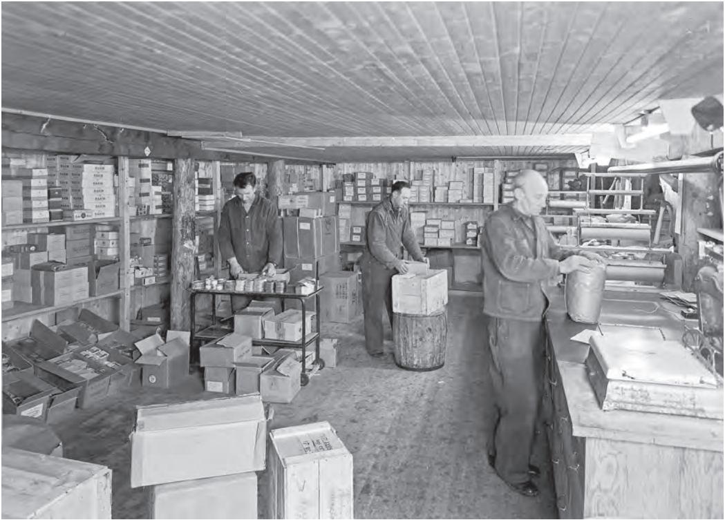
B.I. Brodersens lager i 1953.