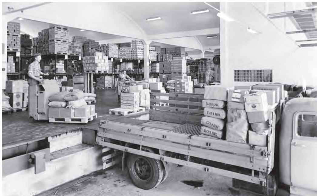
Utkjøring av varer hos FIGRO.

ved hjelp av to stålgafler som plasseres under lasten. Gaffeltrucken ble oppfunnet i 1920 av den amerikanske girkasseprodusenten Clark. 20 Den første i Trondheim kan ha vært i 1950 hos grossistfirma E.A. Smith, som hadde ettplanslager for jern- og byggevarer på Brattøra. 21 Trucken til FIGRO løftet 1½ tonn inn på stålreoler 8 m. over gulvet. 22