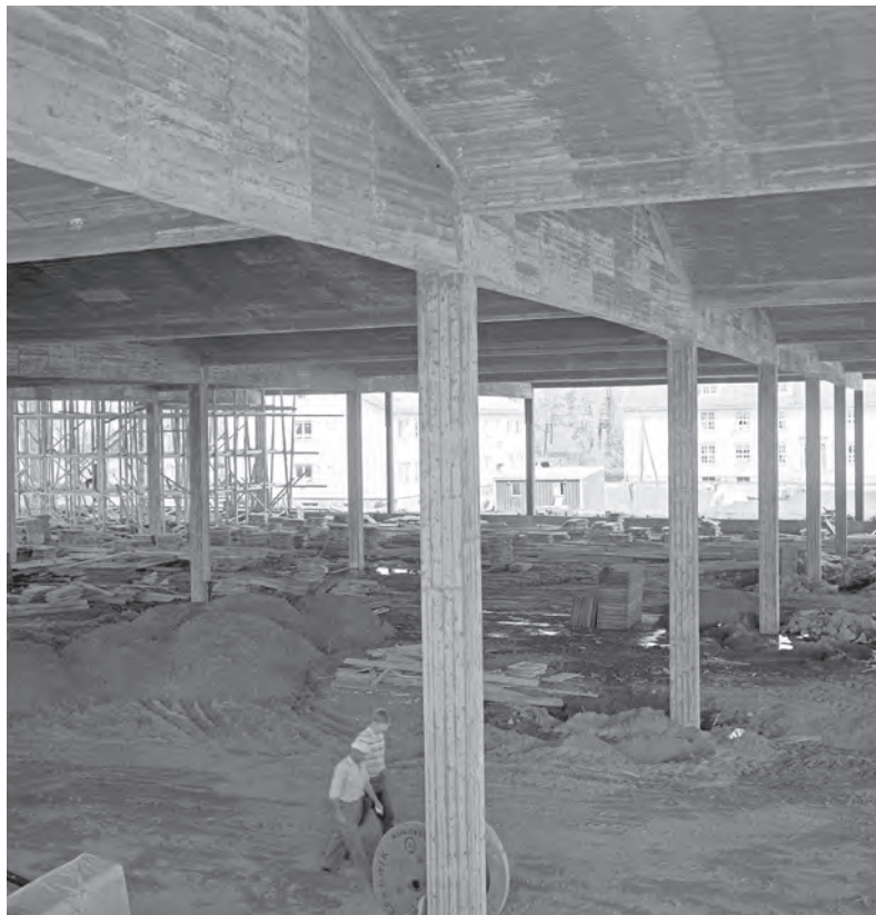
KØFFs lagerhall under bygging i 1961. Det var høyt under taket.