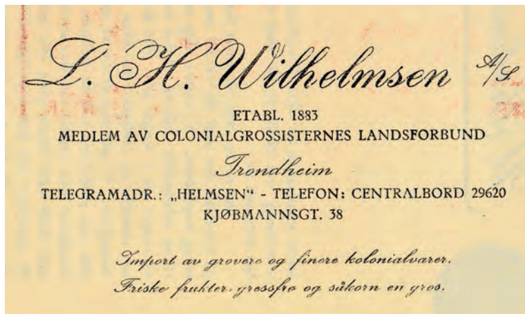
Fra en kundemelding 1949.

handelen som sådan som innenfor bygnings- og transportsektoren. Dertil kanskje en tradisjonisme i tenkesettet.