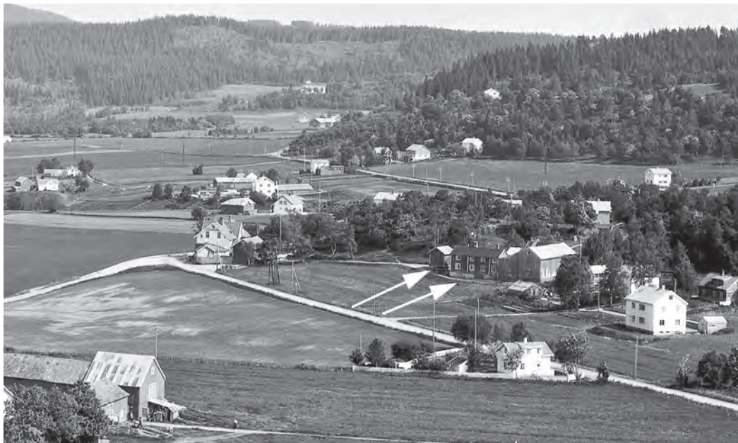
Ramstad i 1958. Familien Tiller bodde i 2. etasje til høyre ved pilene. Til venstre for huset ligger stabburet hvor Nøkken-sangerne avsluttet øvelsene. Gården i forgrunnen til venstre er Åsheim.

Utsnitt av foto tatt av Telemark flyselskap. Foto fra www.flyfotarkivet.no