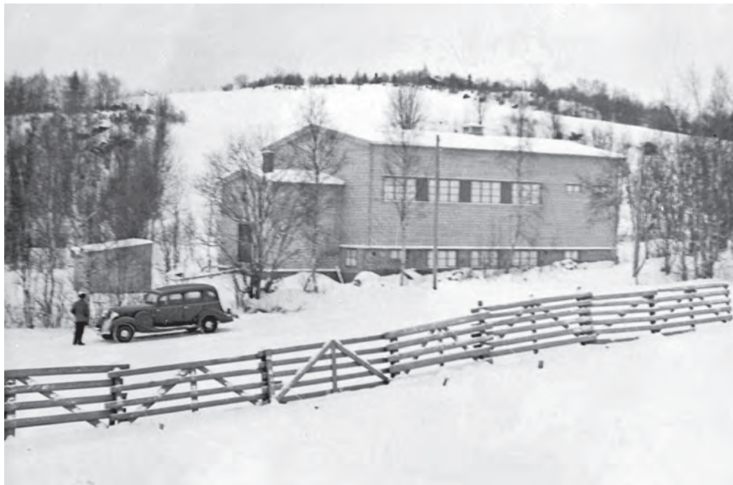
Strinda bygdedomslags forsamlingshus Lohove fotografert av Schrøder i januar 1938. Bygdedomslaget hadde innvielsesfest 26. februar dette året. Foto: Sverresborg Trøndelag folkemuseum.

alkohol. På Veiskillet opptrådte Nøkken for Åsvang sykepleieforening/Åsvang helselag i mange år, og det var mer sporadiske opptrædener for andre lag, som f.eks. Strinda IL og Strinda NKP. Nøkken opptrådte på Veiskillet siste gang i 1984, for Åsvang helselag.