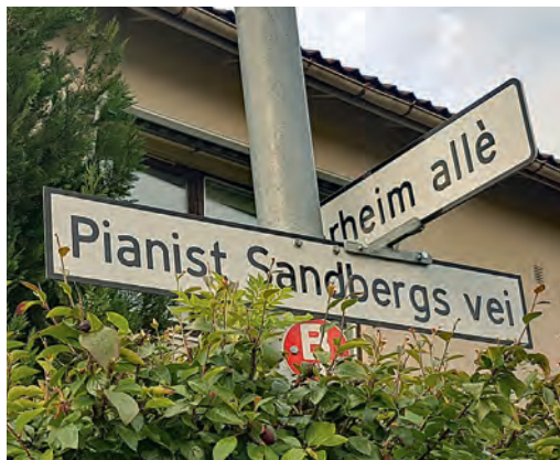
Krysset mellom Pianist Sandbergs vei og Fagerheim allé på Lade.

Jeg har lenge lurt på dette med livet til pianist Sandberg. Skiltet med Pianist Sandbergs vei på Lade har pirret min nysgjerrighet. Hvorfor er yrket med i gatenavnet og ikke fornavn? Å leve et stille, tilbaketrukket liv i lille Trondheim i vinterhalvåret, for så å være omgitt av berømmtheter i musikkens verden i det sørlige