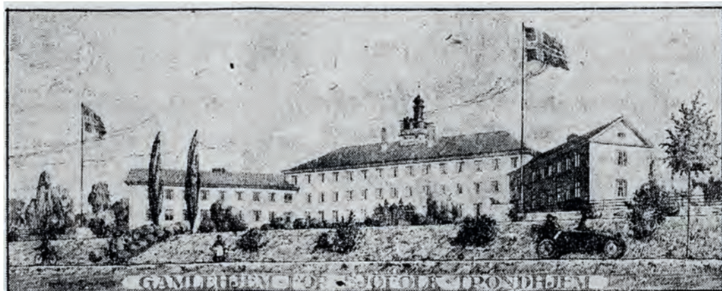
Planlagt bygning. Tegning av arkitekt Johan Osness, gjengitt i Trondhjems Adresseavis 30. oktober 1926.

største skipsfartsnasjoner, og sjøen var en viktig yrkesvei for svært mange norske menn og noen kvinner.