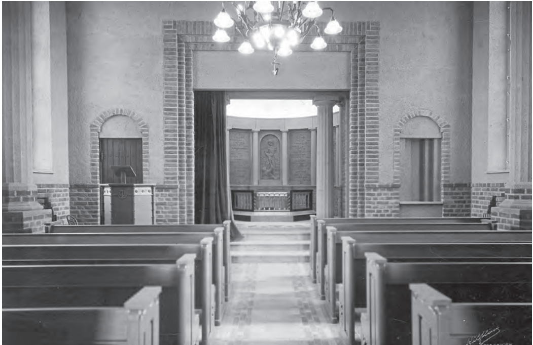
Sjømenns Minnekapell på 1930-tallet, sett mot koret.

bringe sin livskveld. «Sjømennene er dessverre ikke alltid blitt møtt med den forståelse som de burde, men under krigen lærte mange å sette pris på sjøfolkene og deres innsats for land og folk», avsluttet han.