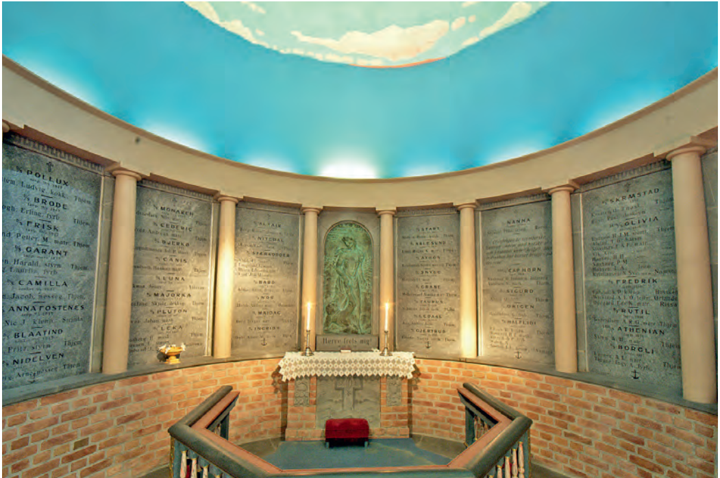
Koret med minnetavler over falne sjøfolk, og bronserelieff av Jesus og Peter på Genesaret sjø. I taket litt av verdenskartet.