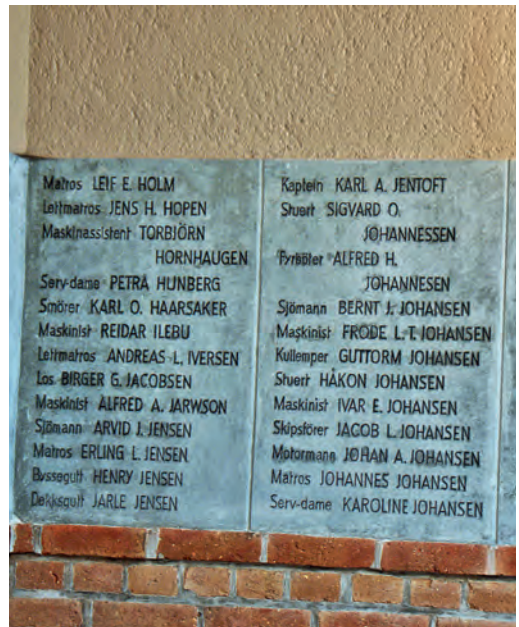
Minnetavler over falne i 1. verdenskrig til venstre og i 2. verdenskrig til høyre.