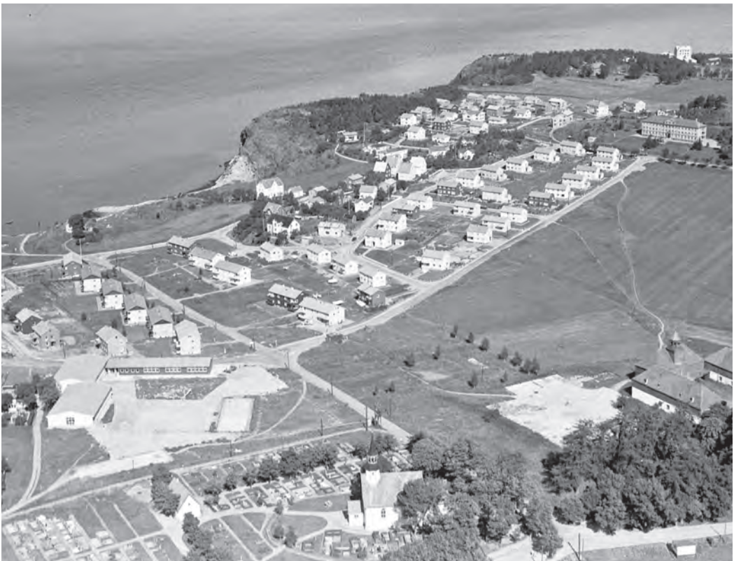
Lade kirke, Lade skole og Korsvika i 1958. Øverst til høyre ser vi Sjømenns aldershjem.

Sjømannshjemmet ligger vakkert til på veien utover Østmarkneset, omgitt av en grønn park med høye trær. På en måte er hjemmets historie en parallell til den norske sjømannstands historie. Det ble bygget mens den norske sjømann ikke bare var et gjennombarket folkeferd, som det heter i sangen. Norge var på denne tiden en av verdens