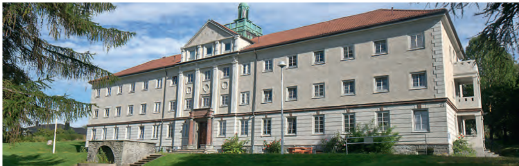
Sjømannshjemmet i 2019.

det de hadde opplevd under og etter krigen. Som kjent ble de ikke tatt godt vare på av det norske samfunnet. Det gikk flere tiår før de fikk sine rettmessige medaljer og takksigelser for de ofrene de hadde gitt for Norge. Mange døde uten å få oppleve noen form for respekt eller oppreisning. Noen av beboerne fikk store problemer med å takle hverdagen etter krigen, mye på grunn av tunge og vonde opplevelser i krigsårene.