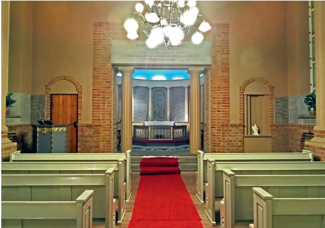
Kapellet med koråpningen i bakgrunnen. Vi ser minnetavlene til venstre og høyre for inngangen. Over inngangen står det: «På veggfeltene i koret – minnehallen – er hogd inn navnene på TRØNDERSKE SJØFOLK som fant sin død ved krigshandlingene til sjøs 1914 – 18. Navnene på dem som fant sin død under tilsvarende handlinger i krigen 1939 – 45 er hogd inn på veggene i skipets». Inne i koret ser vi så vidt kompassrosen rundt alterringen.

er navnene på 99 personer risset inn i den grå steinen. Etter andre verdenskrig kom også i 1950 de 341 navnene på sjøfolk fra Trøndelag som mistet livet under denne krigen. Fortsatt blir det holdt minnegudstjenester over krigsseilerne to ganger i året i det stemningsfulle kapellet.