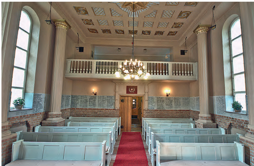
Sjømenns Minnekapell sett mot inngangen. Vi ser minnetavlene langs veggene.

kommunen, som hadde gitt tomta, skulle få hele anlegget tilbake når fagforeningene ikke lenger ønsket å drive det.