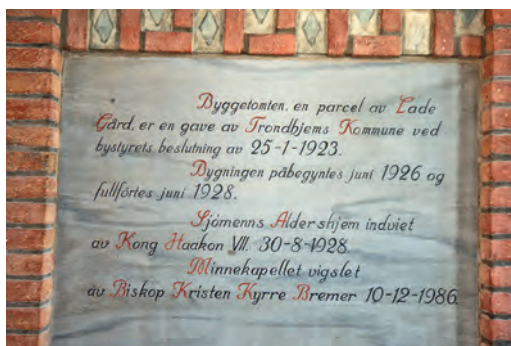
To av tekstfeltene i hovedinngangen.