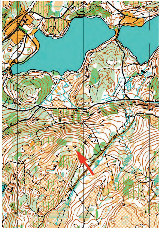
Hytteruinen er tegnet inn på Wings orienteringskart over området – se pil. Estenstad-dammen og Tømmerboltdammen vises øverst på kartet. Takk til Wing orienteringsklubb for bilde av kartutsnitt.