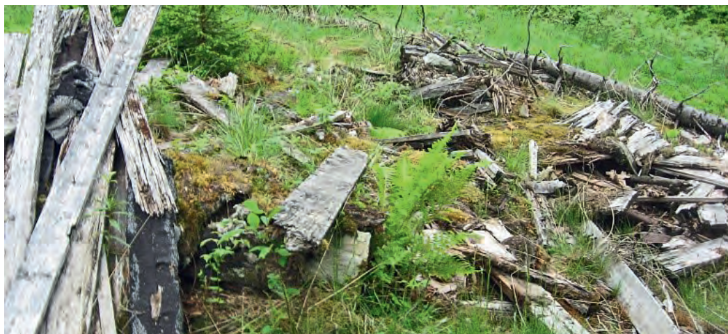
Restene av hytta i 2018.

Jeg husker ikke hvor lenge vi brukte hytta. Speiderpatroljene ble snart oppløst, og da gymnaset var fullført, ble det militæret og spredning av «eierne». Om speidertroppen overtok ansvaret for hytta, vet jeg ikke. Troppsledelsen var som nevnt ikke engasjert i denne hytta.